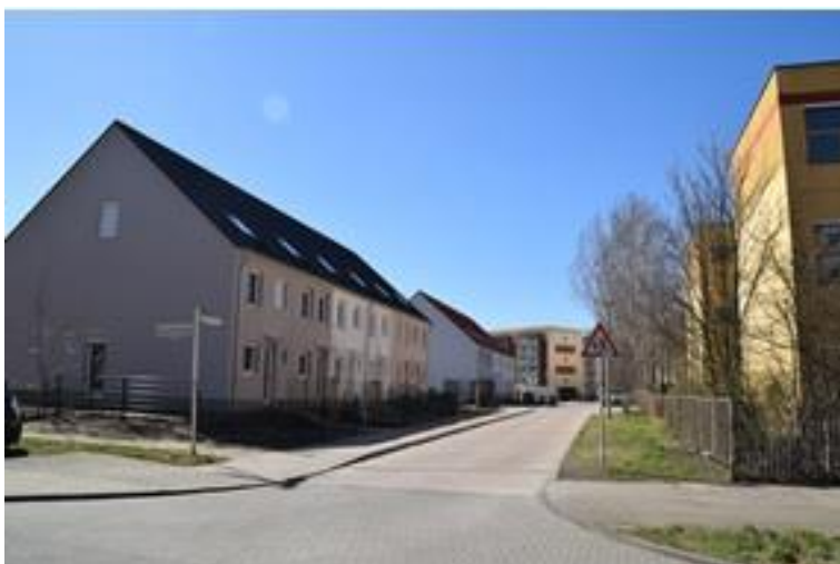
Abb. 3: Starthomes, Fertigstellung 2017

Eine Ausnahme stellen die sogenannten STARTHOMES, 70 hoch standardisierte Reihenhäuser an der Carola-Neher-Straße/ Lili-Grün-Weg/ Lin-Jaldati-Weg, dar.