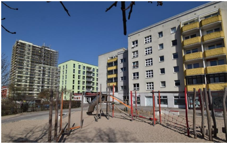
Abb. 2: Typische Wohnbebauung (rechts) im Quartier mit Punkthochhaus im Baustopp (links)

Bauliche Struktur: Das Quartier Boulevard Kastanienallee wurde 1986 bis 1990 in Großtafelbauweise (überwiegend 5-6-geschossige WBS 70 Typenbauten) in mehreren Wohnringen errichtet. Das Wohngebiet umfasst insgesamt ca. 2.795 Wohneinheiten (Stand 2018, ohne Wohnheime) für knapp 6.100 Bewohnerinnen und Bewohner.