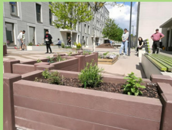
Garten im Hof der Gemeinschaftsunterkunft Paul- Schwenk-Straße