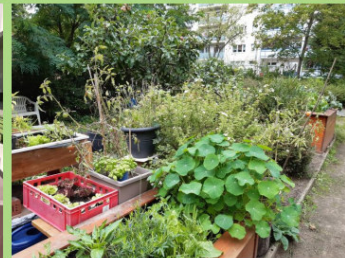
Inklusiver MuRInKa-Garten, Murtzauer Ring