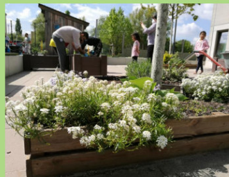
Aufbau eines Gartens: Hochbeetbau in der GU Paul-Schwenk-Straße