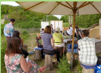
Praxisworkshop im Kienberggarten