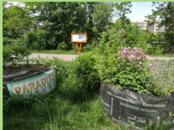
Panoramagarten in Hellersdorf, Louis-Lewin-Straße Ecke Albert- Kuntz-Straße