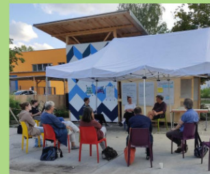
Vernetzungstreffen im Stadtwerk MRZN