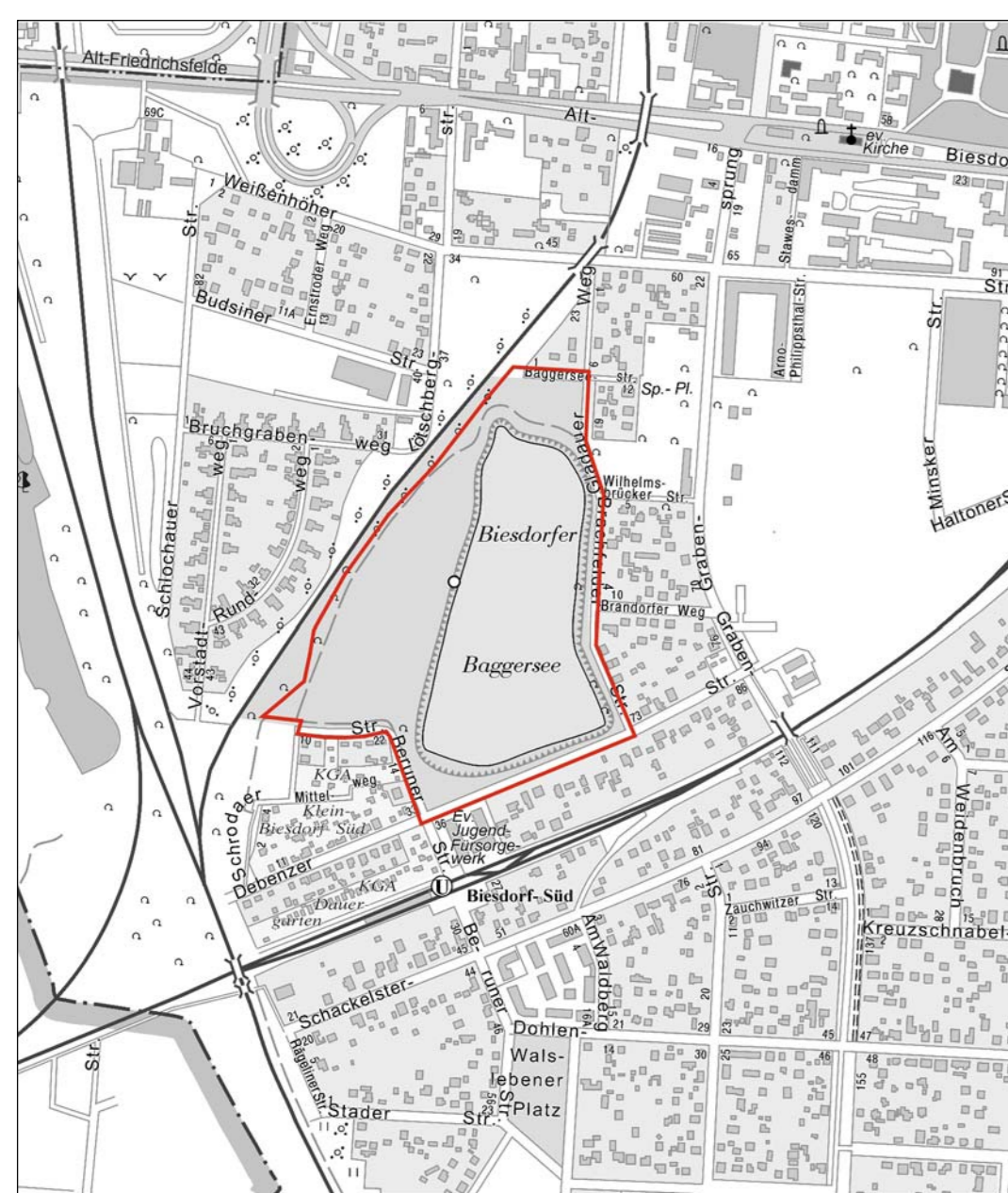
Obersichtskarte 1 : 10.000