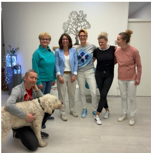
Besuch im Brustzentrum in Mahlsdorf

Hier arbeitet ein hochspezialisiertes Team im Bereich Frauengesundheit, mit einem besonderen Schwerpunkt auf Krebsvorsorge, Behandlung und Nachsorge. Patientinnen werden eng begleitet und individuell betreut. Beeindruckt hat mich neben der medizinischen Expertise auch die einfühlsame und wertschätzende Atmosphäre.