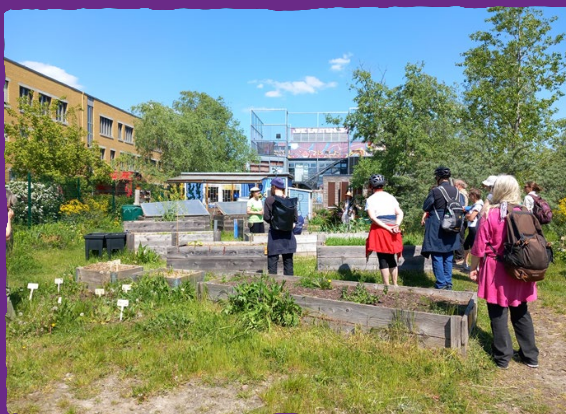
Die Außenküche kann auch von Nachbar*innen genutzt werden.

Die Helle Oase folgt nicht nur beim Gärtnern ganzheitlichen Ideen, auch als sozialer Treffpunkt und Austauschort will sie für möglichst viele Menschen eine Anlaufstelle sein. Umweltbildungsaktionen zu diversen Themen sollen ein Bewusstsein für Natur und Umwelt schaffen. Für die Gartensaison wurde außerdem ein vielfältiges Freizeitangebot geplant, das über das Gärtnern hinausgeht und bei dem alle willkommen sind.