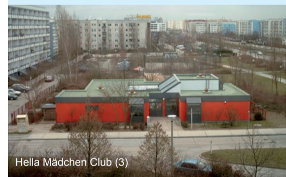
Hella Mädchen Club (3)

Der eingeschossige Pavillonbau ist um einen Innenhof gruppiert und verfügt über einen Veranstaltungsraum mit Bühne und mehrere Gruppenräume. 2003-05 erfolgte eine weitgehende Sanierung des Gebäudes und die Umgestaltung der Freiflächen.