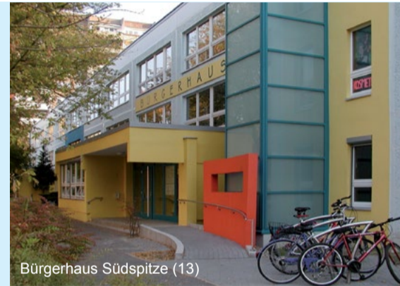
Bürgerhaus Südspitze (13)

Das Stadtteilzentrum in Marzahn-Süd ist das „Bürgerhaus Südspitze“ unter Regie des Trägers BALL e.V. Bei dem Standort handelt es sich um eine ehemalige Kita, die 2004 umgebaut wurde. Die Maßnahmen umfassten die energetische Sanierung, behindertenfreundliche Umbauten und die Einrichtung einer gut nachgefragten Gästewohnung. Die gewerblichen Nutzungen des Hauses ermöglichen eine Subventionierung der soziokulturellen Angebote.