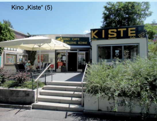
Kino „Kiste“ (5)

Die „Kiste“ in der Nähe des Stadtteilzentrums Helle Mitte und des U-Bahnhofs Hellersdorf ist zugleich Programmokino, Konzertsaal, Freizeiteinrichtung, Café und Galerie. Die Träger „Der Art GmbH“ und „Steinstatt e.V.“ sprechen mit ihrer Programmgestaltung alle Altersgruppen von Jugendlichen bis Senioren an.