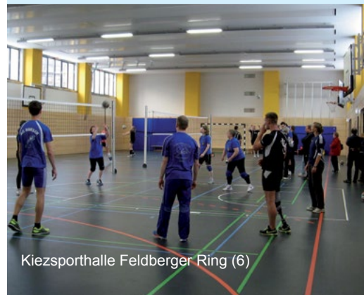
Kiezsporthalle Feldberger Ring (6)

Adresse: Feldberger Ring 17 Finanzierung: Stadtumbau Ost, 1,5 Mio. € Realisierung: 2010 - 2012