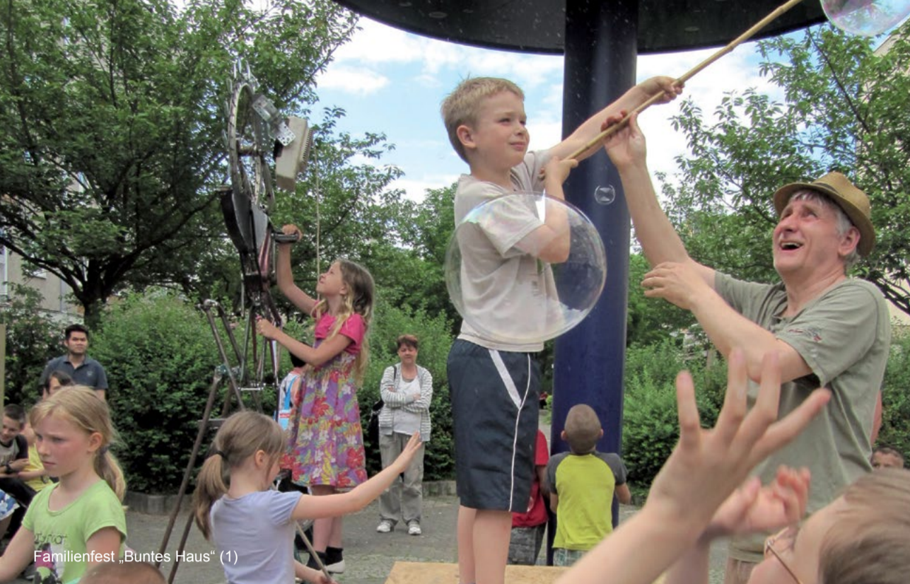
Familienfest „Buntes Haus“ (1)