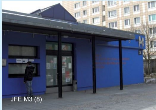
JFE M3 (8)

Das 1978 errichtete Gebäude wurde 2011/12 mit Mitteln aus dem Programm Stadtumbau Ost saniert und um eine Lehrküche und behindertengerechte Sanitärräume erweitert. Bei der Umgestaltung wurde viel Wert auf die Einbeziehung der Wünsche und Anregungen der verschiedenen Nutzergruppen gelegt.