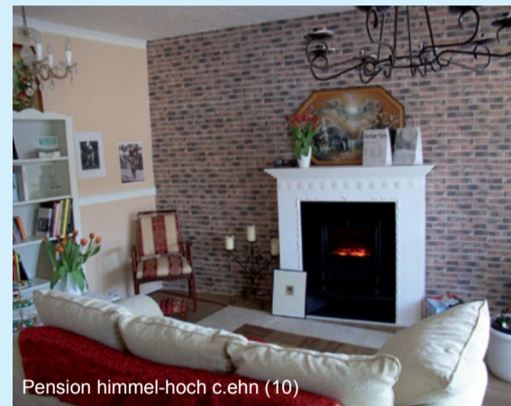
Pension himmel-hoch c.ehn (10)

wurden eingesetzt um die Innenausstattung zu erweitern und das Wohnumfeld der Pension aufzuwerten. Die Pensionen und ihre Betreuer sind gute Botschafter für die lebenswerte Großsiedlung.