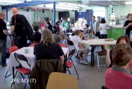
JFE M3 (7)

zu günstigen Preisen bietet es einen offenen Bereich mit Cafébetrieb, Spielen, Sport, Hausaufgabenhilfe, PC-Plätzen und Beratungen. Außerdem zählt das „M3“ zu den drei Standorten im Bezirk, in denen Übernachtungen von Jugendgruppen möglich sind und daher internationale Jugendbegegnungen durchgeführt werden können. Sofern am Wochenende keine Projekte oder Veranstaltungen stattfinden, können auch AnwohnerInnen die Räume mieten.