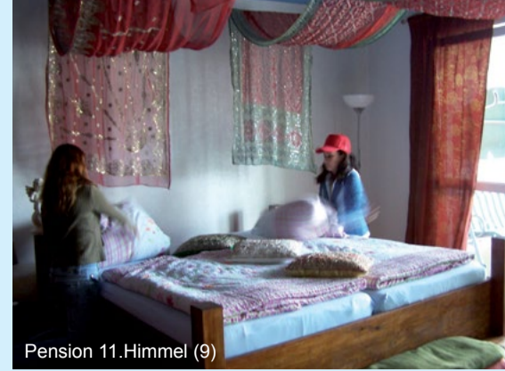
Pension 11.Himmel (9)

Die Projektidee entstand aus einem internationalen Kunstprojekt vom „Kinderkeller“ und vom „Hochhauscafé“ des Kinderring Berlin e.V. Die Wohnungsgesellschaft stellt die 5-Raum-Wohnung auf der obersten Etage des 11geschossigen Hochhauses dem Projekt mietfrei zur Verfügung. Kinder und Jugendliche haben die Räume nach eigenen Ideen eingerichtet. Die Gäste können im „Prinzessenzimmer“ in einem riesigen Himmelbett schlafen oder sich im Zimmer „Kornfeld“ in einer Hängematte schaukeln. Zur Ausstattung gehören auch ein Lese- und Esszimmer, eine voll ausgestattete Küche und ein Balkon. Kinder, Jugendliche und ihre Eltern haben auch die Betreuung der Pension übernommen, und erlernen so Grundzüge des Beherbergungsgewerbes. Das Projekt ist so erfolgreich, dass inzwischen im 10. Geschoss die zweite Pension „himmelhoch c.ehn“ eröffnet hat, u.a. erwartet die internationalen Gäste ein „blaues Zimmer mit Meeresrauschen“, ein Kaminzimmer und ein Klavier. Die Stadtumbau-Mittel