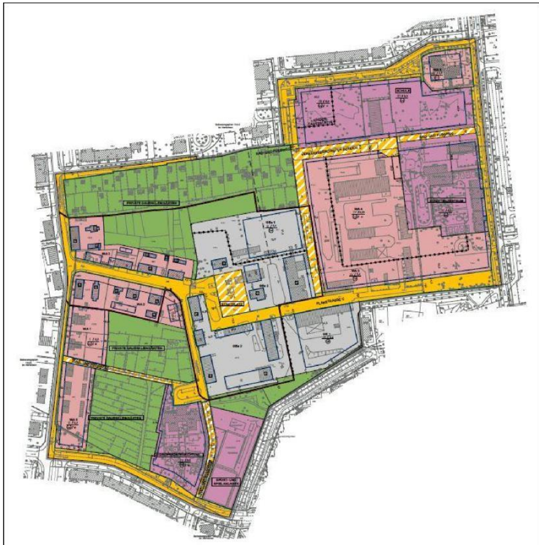
Abbildung 4: Entwurfsstand Bebauungsplan 10-45 (Stand 09/18), Bezirk.

Das Teilvorhaben Süd beschränkt sich auf Grundstücke innerhalb des Bebauungsplangebiets 10-45. Die GESOBAU AG ist Eigentümerin der Grundstücke zwischen der Straße Alt-Hellersdorf sowie dem Libertypark und der Kastanienallee. Die Grundstücke haben eine Gesamtfläche von ca. 89.000 m 2 .