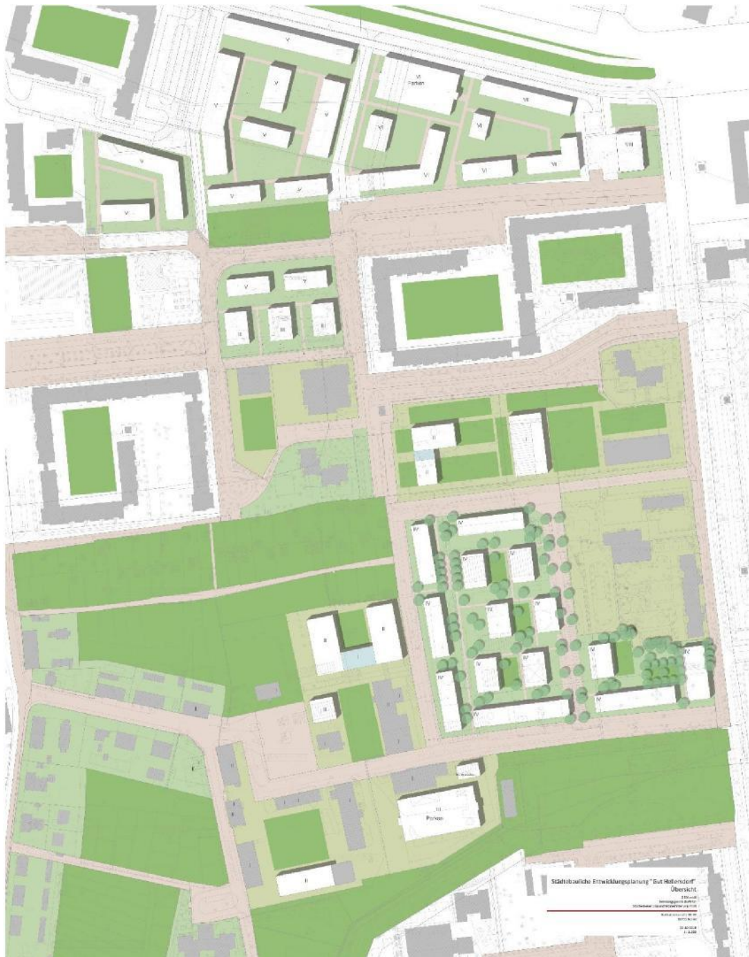
Abbildung 2: Städtebauliches Konzept „Gut Hellersdorf“ (Arbeitsstand 10/18), BSM.