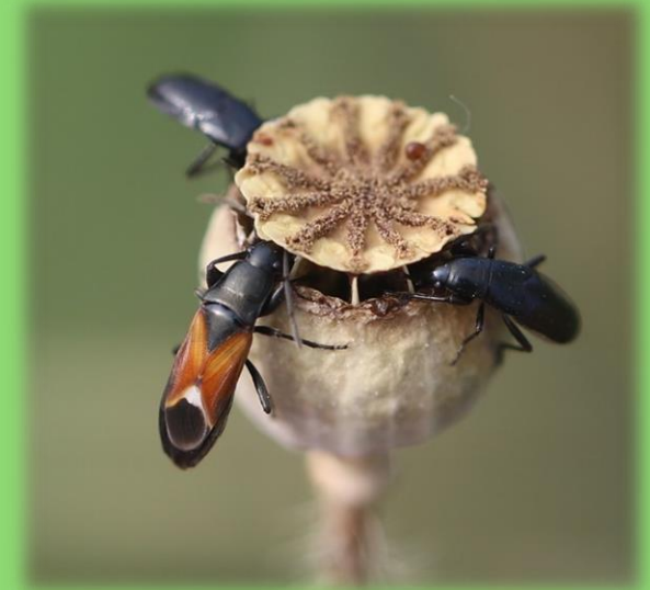
© Ralf Huber, Wikimedia Commons , CC BY-SA 4.0