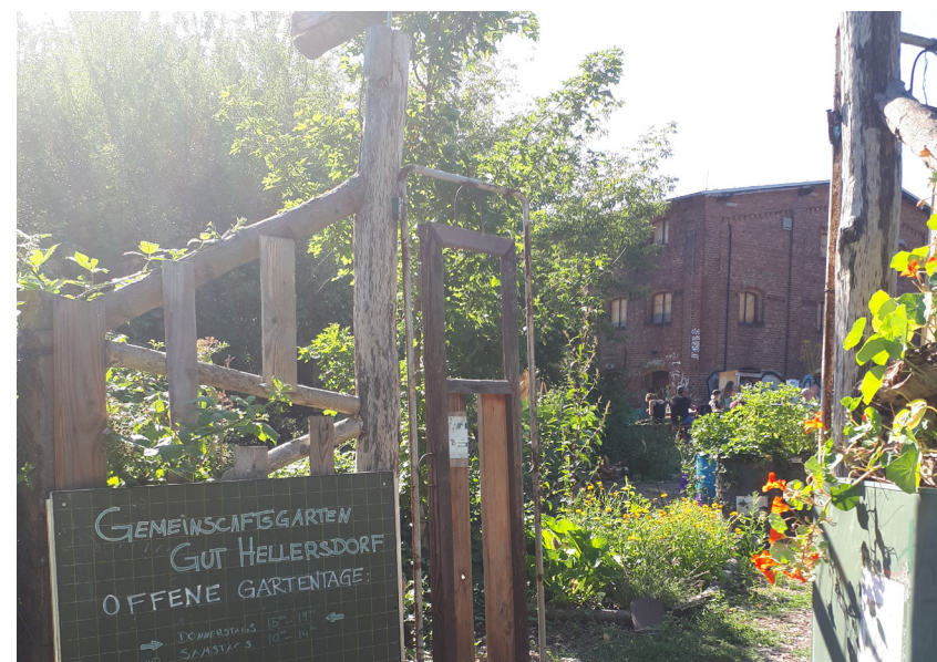
Nachbarschaft entsteht auch beim gemeinsamen Gärtnern: Der Gemeinschaftsgarten „Der Gutsgarten“ bleibt dem neuen Stadtquartier erhalten.

Die Kleingartenanlage „Alt Hellersdorf“ mit ihren 48 Parzellen ist für viele Bewohner aus den umliegenden Geschossbauten eine kleine Oase im Bezirk. Das Gärtnern auf einer „eigenen“ Scholle macht Freude und trägt zur Artenvielfalt von Insekten und Pflanzen bei. Der Bebauungsplan 10-45 sieht eine Erweiterung der Fläche vor, sodass einige zusätzliche Gärten angelegt werden können. Ihre Bewerbungen für eine Parzelle richten Sie bitte an den Vereinsvorstand der Kleingartenanlage. Weitere Infos finden Sie auf: www.hellersdorfgartenfreunde.de .