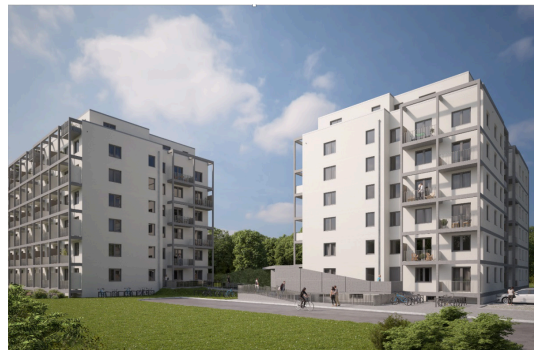
In den zwei GESOBAU-Mehrfamilienhäusern in der Stendaler Straße sind noch Wohnungen frei.

Sie haben Interesse an einer Wohnung in Hellersdorf? Informieren Sie sich über unseren Wohnungsbestand unter www.gesobau.de oder setzen Sie sich direkt mit unserem Vermietungsbüro in Verbindung: Tel. (030) 40 73 – 23 70, E-Mail: neubau@gesobau.de