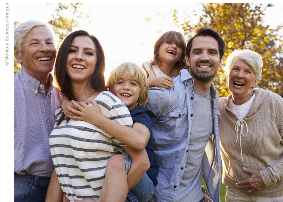
Im lebendigen Quartier finden alle Generationen und Menschen mit verschiedensten Herkünften ein Zuhause.

Wie im ersten Bürgerbeteiligungsverfahren abgestimmt, werden die Straßen im neuen Quartier für alle Verkehrsteilnehmer attraktiv gestaltet und teilweise als verkehrsberuhigte Bereiche gebaut. Das trägt in vielfacher Hinsicht zur Beruhigung im Stadtgut bei. Erfahrungen aus anderen Städten weisen eindeutig nach, dass die Unfallzahlen eher sinken als ansteigen. Zwischen den beiden Schulen, der Pustebume-Grundschule und der W.-A.-Mozart-Schule, ist sogar ein Wechsel mit nur einer Straßenüberquerung auf öffentlichen Straßen ohne Pkw-Verkehr möglich. Die Autos der Anwohner werden in zwei Parkhäusern, den sogenannten Quartiersgaragen, untergebracht, nur wenige Gehminuten von den neuen Wohnhäusern entfernt. Ein kurzzeitiges Be- und Entladen in Wohnnähe ist weiterhin auch auf allen Quartiersstraßen möglich.