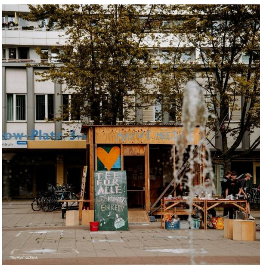
Das Tinyhouse am Anton-Saefkow-Platz

„MAY WE MEET?“ verstand Begegnung dabei nicht als beiläufiges Ereignis, sondern als bewussten sozialen und kulturellen Prozess. Das Projekt zeigte wie öffentliche Räume durch gemeinsames Handeln neu belebt werden können und wie Schule, Kunst und Stadtgesellschaft zusammenwirken, um Teilhabe und Zusammenhalt im Kiez zu stärken.