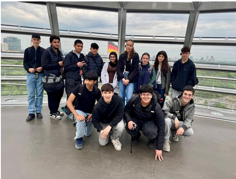
Besuch der Reichstagkuppel