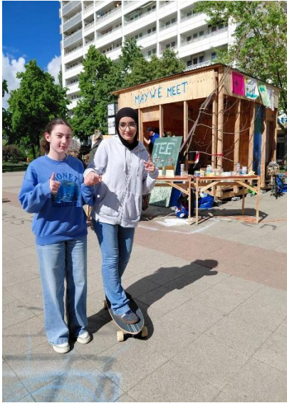
Schülerinnen aus Wien am Tiny House