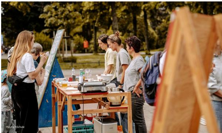
An manchen Tagen gab es Waffeln.