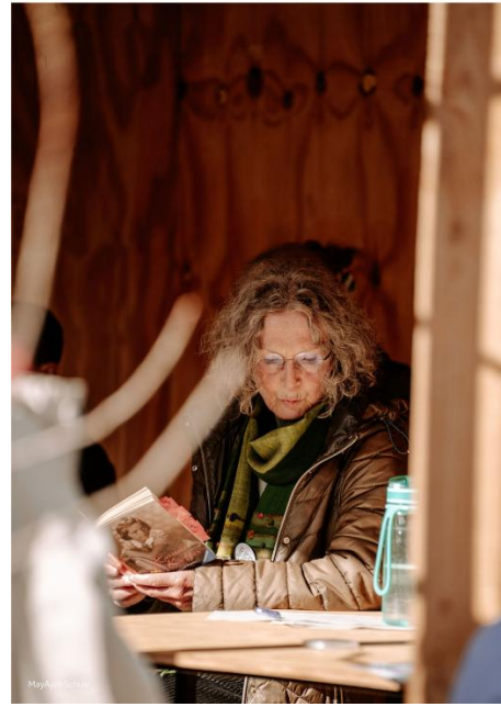
Lesungen im Tiny House