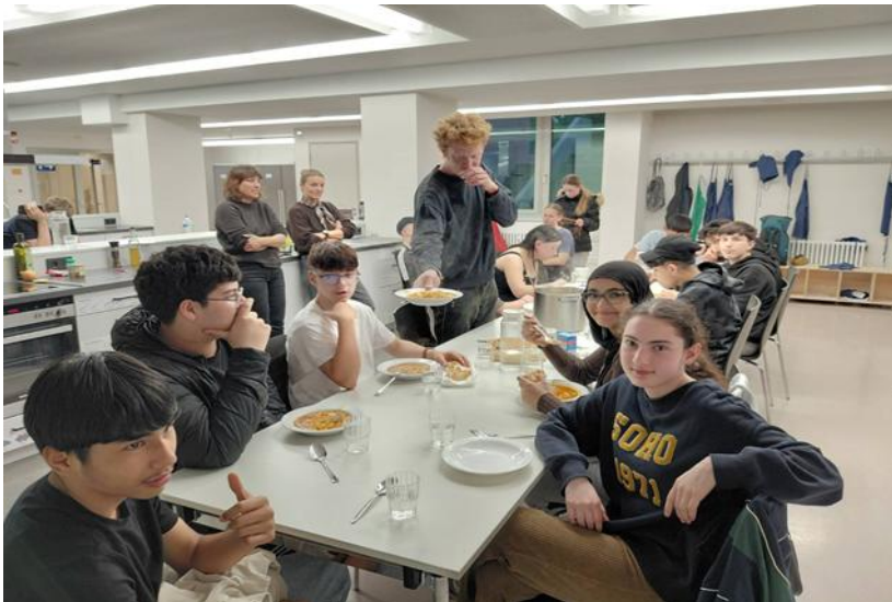
Wien kochten jeden Abend gemeinsam in der Schulküche der May-Ayim-Schule.