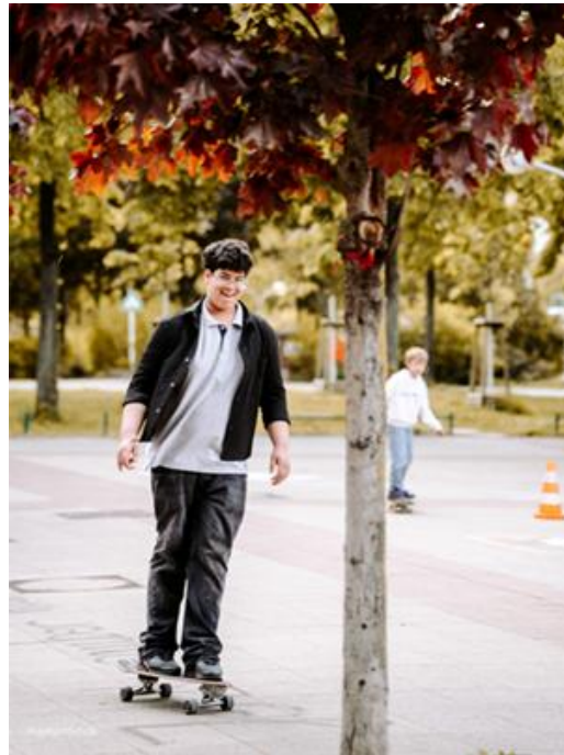
Skaten am Tiny House