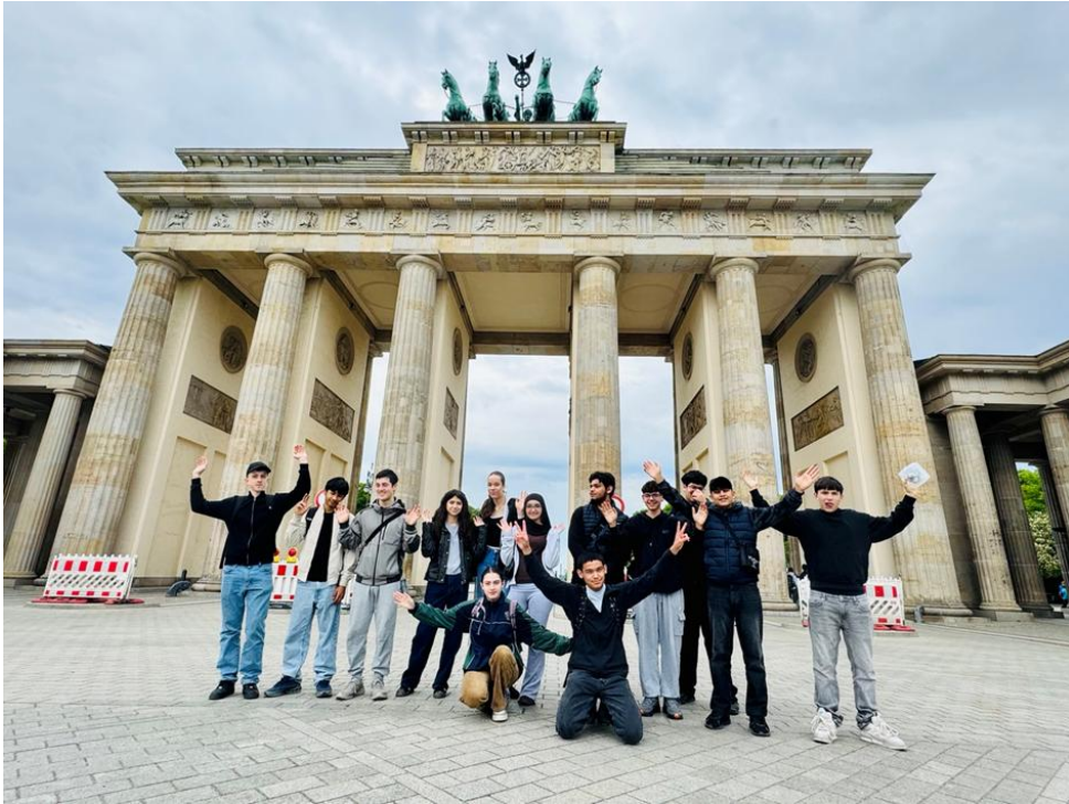
Gemeinsamer Spaziergang im Regierungsviertel