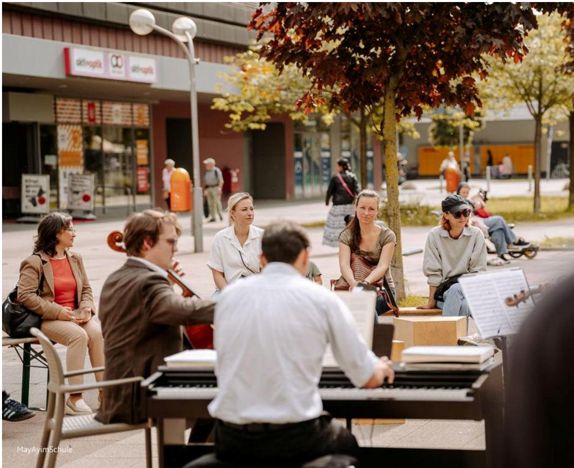
Konzert am Tinyhouse