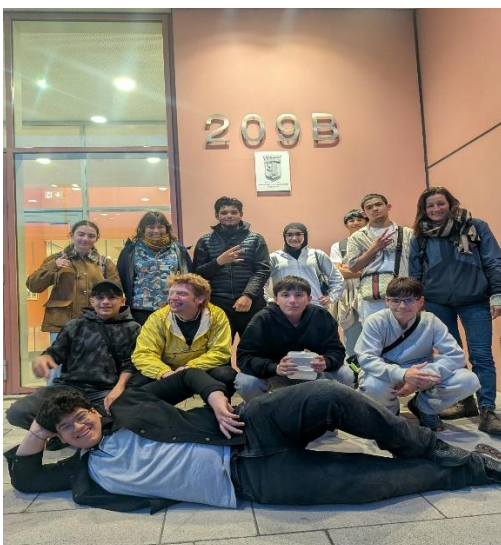
Gruppenfoto vor der May-Ayim-Schule