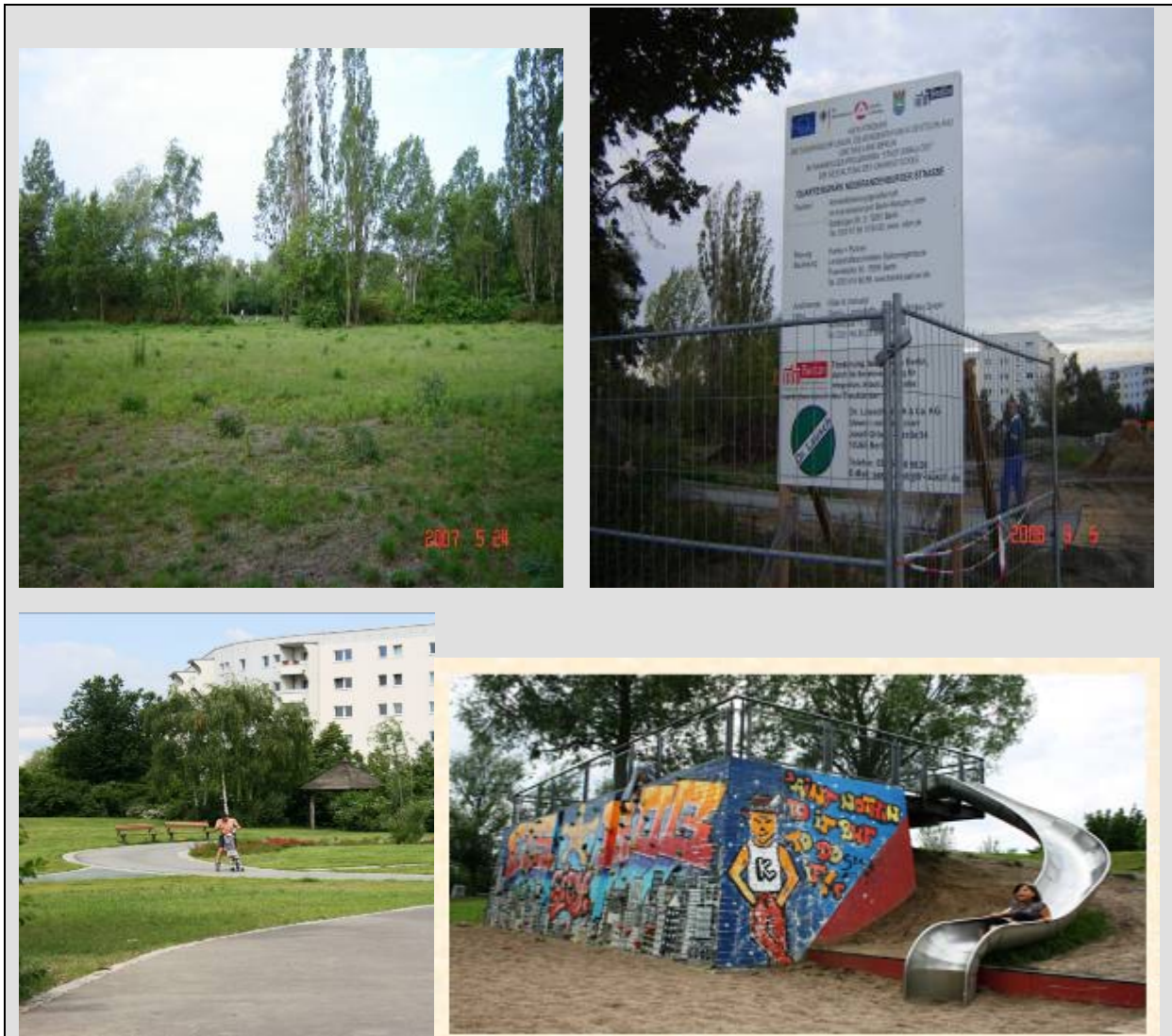
Beispiel: Von der Brache Neubrandenburger Straße (ehemals Schulstandorte) zum Quartierspark mit Spielräumen

Aus den dargestellten Ergebnissen können erste Schlussfolgerungen abgeleitet werden. Dort wo alte Spielstrukturen und/oder bauliche Angsträume festgestellt wurden, ergeben sich Umgestaltungsbedarfe. Angsträume sollten schnellstmöglich beseitigt werden, wobei deren Rückbau kurz- bis mittelfristig eingeplant und umgesetzt werden muss. Als besonders hilfreich bei der Planung wird die Kooperation mit Kinder- und Jugendbeauftragten, Kiezbeauftragten und Baubeiräten eingeschätzt.