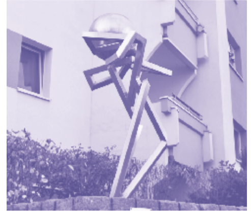
5 Der Traum vom Polydem KÜNSTLER: Günter Maser (1993) MATERIAL: Stahl

Die Pferdeplastik stammt aus dem Jahr 1986, wurde aber erst 1992 vor Ort aufgestellt. 1981 fertigte der Künstler ein sehr ähnliches Pferd, ebenfalls als „Sinnbild für jede geschundene Kreatur“, welches seit 2014 in seiner Heimatstadt Rostock steht.