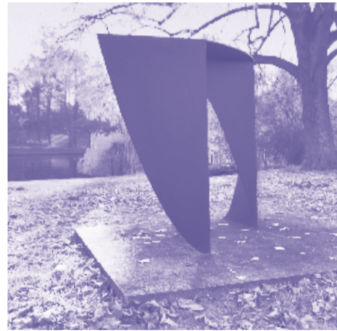
10 Aufsicht um die Kante KÜNSTLERIN: Ruth Baumann (1994) MATERIAL: Stahl

In der Zingster Straße sind drei weitere Skulpturen von Kühn: „Regentropfen“, „Gräser im Wind“ und „Regenbogen“.