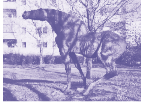
4 Schreiender Hengst KÜNSTLER: Jo Jastram (1986) MATERIAL: Bronze

Zahlreiche Werke des in Delitzsch geborenen Künstlers schmücken öffentliche Plätze in Ost-Berliner Ortsteilen. Die meisten gehören allerdings zur Stilrichtung des Sozialistischen Realismus.