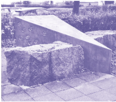
6 Kinderhände KÜNSTLER: Günter Maser (1997) MATERIAL: Granit, Neusilber

Von Günter Maser gibt es neben „Traum vom Polydem“ und „Kinderhände“ noch zwei weitere Objekte in Hohenschönhausen: Eine Sonnenuhr und eine Stelengruppe.