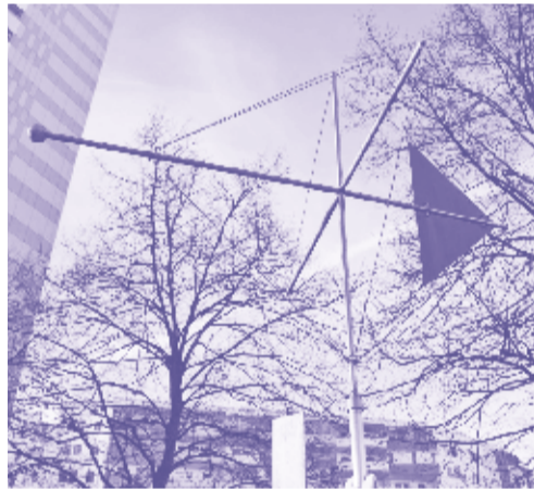
8 Schneekristall KÜNSTLER: Achim Kühn (1996) MATERIAL: Stahl

„Sehr schnell kam mir der Gedanke, den Prozess des Schaffens zu erweitern, zu erweitern auf die, für die diese Skulptur geschaffen werden sollte.“ (Günter Maser)