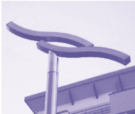
13 Kinetisches Objekt KÜNSTLER: Bernhard W. Blank (1996) MATERIAL: Stahl

Der Kunstschmied Gösta Gablick leitete ab 1980 die Lehrwerkstatt im VEB Kunstschmiede Weißensee und machte sich 1990 als Kunstschmied selbständig.