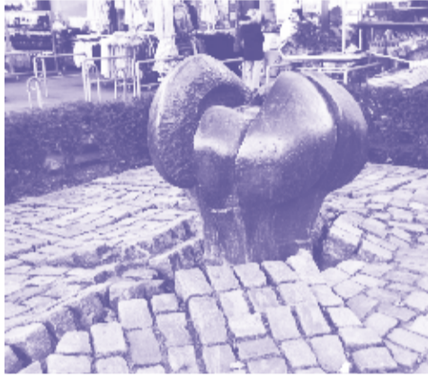
2 Erde, fruchtbringend KÜNSTLER: Stephan J. Möller (1990) MATERIAL: Bronze, Pflasterstein

BERG ALS DU DENKST. MEHR BERLIN LICHTENBERG