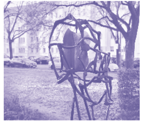
11 Die Gedanken sind frei KÜNSTLER: Gösta Gablick (1996) MATERIAL: Metall, Granit

Die Skulptur steht seit 1994 im Garten des Mies van der Rohe Hauses.