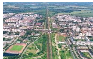
Blick auf die Großsiedlung Hohenschönhausen