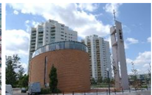
Kirche zu Wartenberg