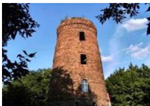
Wasserturm am Obersee