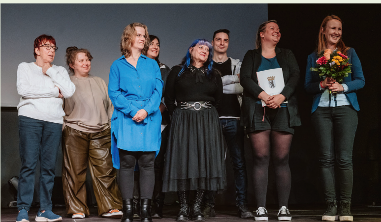
Den Tierschutzpreis nahm ein Team der Berliner Tiertafel entgegen.