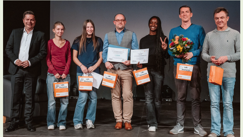
Lernen-durch-Engagement-Preis für Schüler:innen und Lehrkräfte des 12. Gymnasiums Lichtenberg.