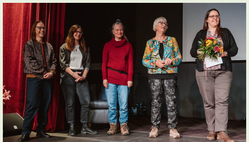
Der Umwelt- und Naturschutzpreis 2025 ging an die NABU AG Rummelsburger Bucht.