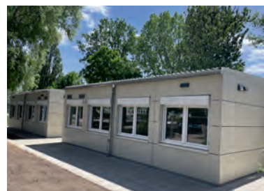
Sechs zusätzliche Unterrichtsräume in Form einer Containeranlage hat die Adam-Ries-Schule in Alt-Friedrichsfelde bekommen.

Nach dem Baubeginn Mitte Januar dieses Jahres stehen der Adam-Ries-Schule dank dieser Container nun sechs zusätzliche Klassenräume mit je circa 53 Quadratmetern Grundfläche für etwa 24 bis 26 Schüler zur Verfügung. In die Anlage wurden Sanitäräume und ein barrierefreies WC integriert. Bezirksstadträtin für