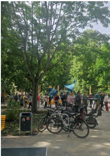
An der Einbeckerstraße ist jetzt der neugestaltete Spielplatz für Kinder aus dem Kiez da.

Kinder können in der Einbecker Straße 113 in Friedrichsfelde einen neugestalteten Spielplatz entdecken. Bezirksstadträtin Filiz Keküllüoğlu (Bündnis 90/Die Grünen) eröffnete die neue Anlage, die sich an Kinder im Alter von drei bis sechs Jahren richtet. 18 Auszubildende des Bezirks haben den Spielplatz im Rahmen eines Lehrlingsprojekts geplant und gebaut. Die Auszubildenden werden für die Bezirke Lichtenberg und Friedrichshain-Kreuzberg qualifiziert und übernehmen während ihrer Ausbildung Verantwortung für Projekte, die das Leben im Kiez verbessern. „Mit dem neuen Spielplatz schaffen wir einen Ort, an dem Kinder spielen und Familien zusammenkommen können. Unsere Auszubildenden haben hier wertvolle Erfahrungen gesammelt und gleichzeitig etwas geschaffen, das den Menschen im Kiez langfristig zugutekommt“, sagt Bezirksstadträtin Filiz Keküllüoğlu. Die Spielgeräte greifen die Formensprache von Origami-Faltfiguren auf und laden zum Klettern, Balancieren und Ausprobieren ein. Neue Sitzmöglichkeiten bieten Eltern und Begleitpersonen Platz zum Verweilen. Ergänzt wird die Anlage durch eine Tischtennisplatte, Fahrradständer und aufgewertete Grünflächen mit zusätzlichen Pflanzungen. In die Neugestaltung investierte der Bezirk rund 250.000 Euro.