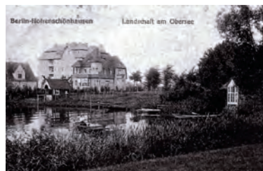
Historische Postkarte vom Obersee.

Eine Erinnerungsstele im öffentlichen Straßenland wird künftig über den Wandel Alt-Hohenschönhausens von einer dörflichen Randgemeinde zu einem Berliner Ortsteil informieren. Eingeweiht wird die Stele am 11. September, um 17 Uhr in der Degnerstraße 30/32.