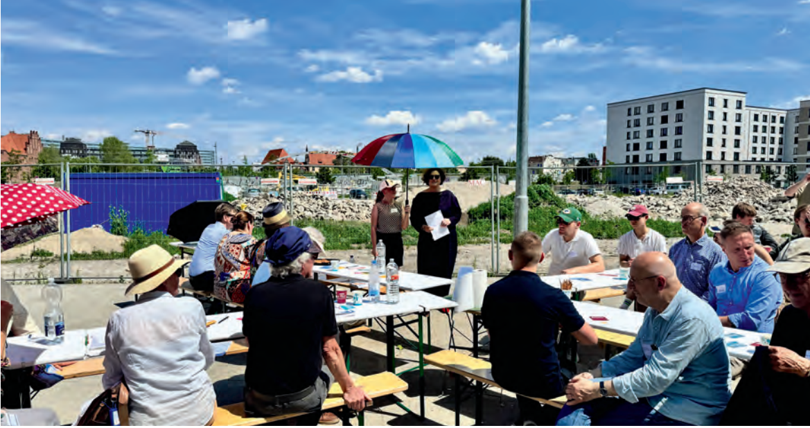
Zum Thema "Baukultur" traf sich nahe der Baustelle für das Ocean Berlin eine Runde aus Stadtentwicklung, Planung, Architektur und Verwaltung.