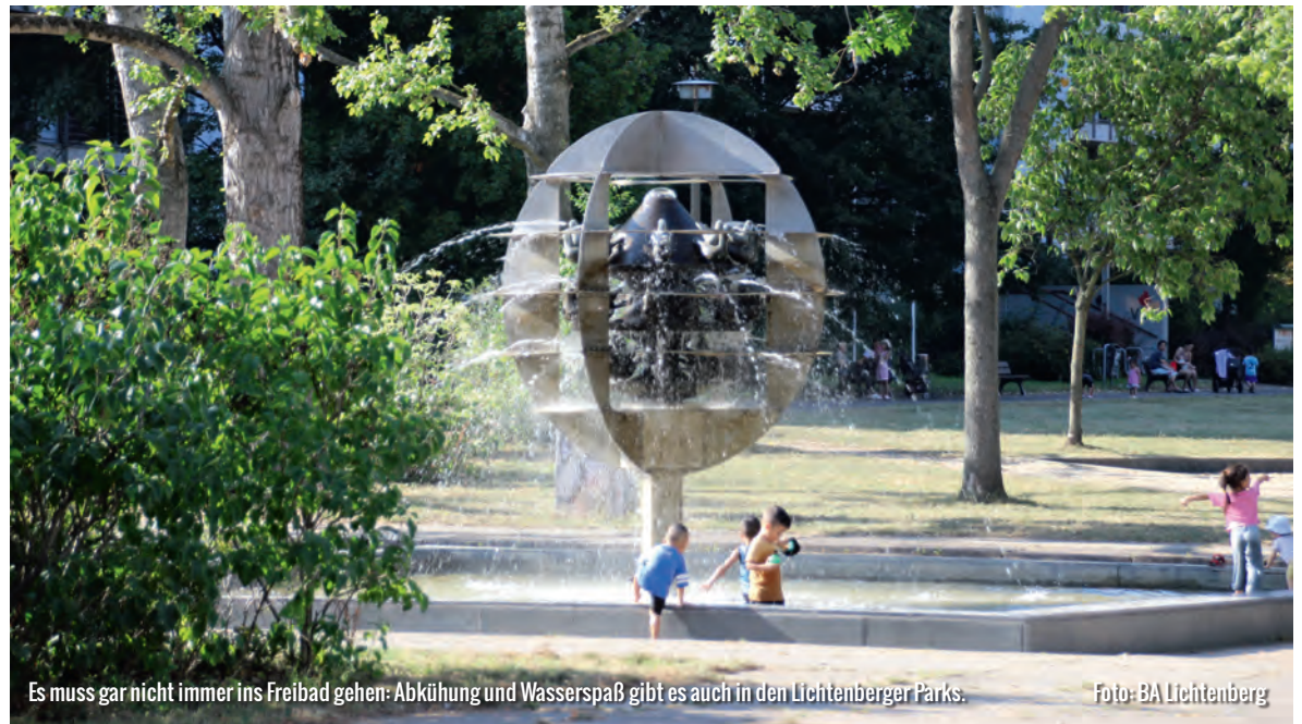
Es muss gar nicht immer ins Freibad gehen: Abkühlung und Wasserspaß gibt es auch in den Lichtenberger Parks.

www.lichtenberg.berlin.de Redaktion und Vertrieb: Telefon 9 02 96-3312