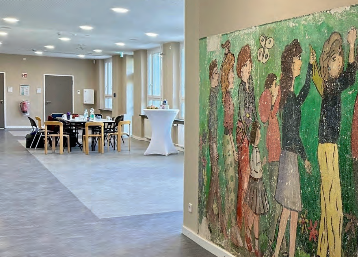
Geschichte geht in Gegenwart auf: ein Wandbild aus den 1960er-Jahren ist nun nach den Sanierungsarbeiten in der KULTschule wieder sichtbar.