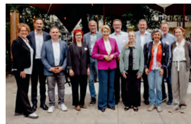
Leiterinnen und Leiter der Wirtschaftsförderungen mit Senatorin Franziska Giffey.

Unter dem Motto „Gestalten. Vernetzen. Bewegen.“ fand Anfang Juni die erste gemeinsame Wirtschaftsförderungskonferenz der zwölf Berliner Bezirke statt. Mehr als 200 Vertreterinnen und Vertreter aus Wirtschaft, Politik, Verwaltung und Verbänden kamen zusammen, um über aktuelle Herausforderungen und die Zukunft der bezirklichen Wirtschaftsförderung zu diskutieren. Im Mittelpunkt standen Themen wie die Sicherung von Gewerbeflächen, die Transformation von Gewerbe- und Industriegebieten, die Entwicklung von Geschäftsstraßen und die Zusammenarbeit mit Ar-