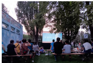
Gemeinsam und draußen Kino schauen: Im Sommer 2026 ist das wieder möglich.

Gemeinsam mit Trägern, Stadtteilrichtungen, der Stiftung Stadtkultur und Nachbarschaftsprojekten ist es gelungen, das „Kino für Alle“ seit 2021 auszubauen. Was mit einzelnen Vorführungen begann, hat sich zu einer festen Größe im Sommerprogramm entwickelt: offen, niedrigschwellig und für Menschen jeden Alters zugänglich. Von Juli bis September verwandeln sich Grünanlagen, Höfe und Nachbarschaftsorte in Freiluftkino. Viele Veranstaltungen beginnen mit Snacks, Musik oder Aktivitäten, alles ist kostenlos und ohne Anmeldung. Termine: 9. Juli: „Sisterqueens“, Filmstart 15.30 Uhr, Cabuwazi-Zirkuszelt, Wartenberger Straße 175; 22. Juli: „Die Mitte der Welt“, Filmstart 20.15 Uhr, Wiese am STZ Welsekiosk, Falkenberger Chaussee 136; 7. August: „Robot Dreams“ Filmstart 20.45 Uhr, Grünanlage Weiße Taube, Schalkauer Straße 31; 14. August: „Alles steht Kopf“ Filmstart 20.30 Uhr, Mein Falkenberg Kiez, Henriette-Herz-Allee/