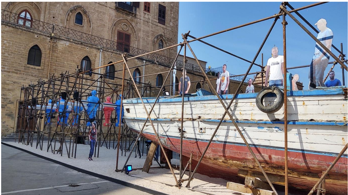
Hinter dem Boot, der übergroße Kicker

Besucher können sich selbst in diesen Kicker stellen, und die 2 m großen Fußballfiguren in Bewegung versetzen. Diejenigen, die glücklich in Europa gelandet sind, stellen dann oft fest, dass der Kampf ums Glück noch lange nicht zu Ende ist.