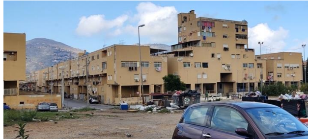
Das ZEN 2

Am Montag früh stand dann „ZEN“ (Zona Espansione Nord oder offiziell: San Filippo Neri) auf dem Plan. Zen ist ein Wohngebiet, ein sozialer Brennpunkt weit im Norden der Stadt. ZEN besteht aus zwei Wohngebieten, die ZEN 1 wurde 1969 als sozialer Wohnungsbau fertiggestellt und ist auch bewohnbar, obwohl man bei der Infrastrukturplanung vergessen hat, Platz für Läden, Bars, Sport, Spielplätze,