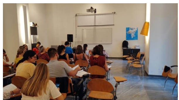
Der Sprachkurs in meiner Klasse