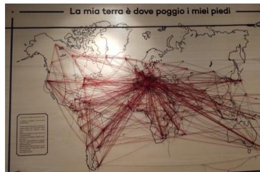
Es ist mein Land, wohin ich meine Füße stelle

Das Moltivolti ist eine gemeinnützige Organisation, es unterstützt viele soziale Projekte und betreibt verantwortungsvolle Tourismusprogramme wie z.B. in Marokko, Nepal, Senegal, Tansania und natürlich auf Sizilien. Vorurteile sollen abgebaut werden und die Interaktion verschiedener Kulturen befördert.