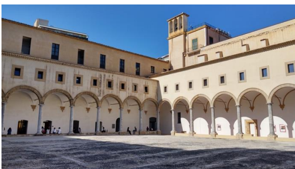
Die Universität in Palermo

Anschließend gehen wir in die Universität Palermos um einen Einstufungstest meiner Italienischkenntnisse zu machen. Denn schon heute Abend beginnt mein erster Italienischunterricht, der nun dreimal in der Woche am Abend stattfinden wird. Ein tolles Angebot wie ich finde, denn mit englisch fühle ich mich in Palermo ziemlich aufgeschmissen.