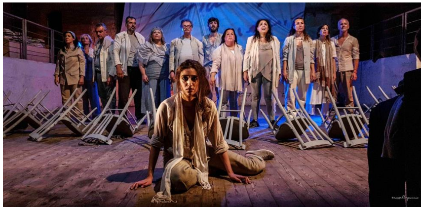
DanisinniLab, Bild: Rossella Puccio

Meine Mentorin Frau Messina lädt mich bereits am Sonntagabend zu einem Stadtfest ein, bei dem Sie, in einem wirklich aufreibenden Theaterstück, selbst mitspielt. DanisinniLab - Es geht darum, wie wir die Grenzen aller Vorurteile überwinden können. Ich bin beeindruckt!