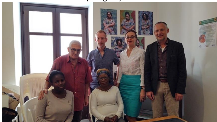
In den Räumen von Donne di Benin City