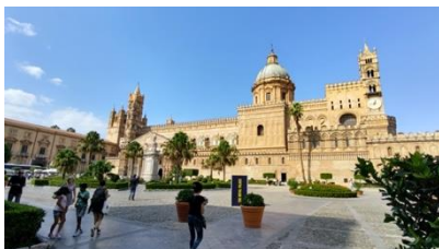
Kathedrale von Palermo

Nach nun schon drei Wochen in Palermo, bemerke ich ein Gefühl von Alltag und Routine. Die Stadt hat aber noch viele interessante Sehenswürdigkeiten für mich bereit, so dass kaum lange Weile aufkommen sollte, auch wenn ich hin und wieder Familie, Freunde und Kolleg*innen vermisse.