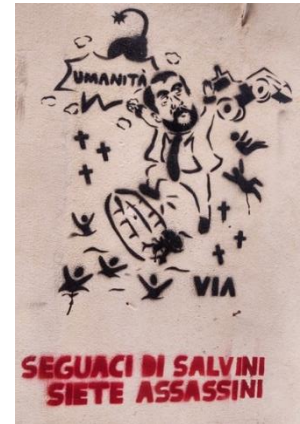
Graffiti wie dieses finden sich häufig in Palermo. Anhänger Salvinis, ihr seid Mörder

Am Mittwoch gehe ich ins „centro astalli Palermo“, ein Verein des Jesuiten-Flüchtlingsdienstes. Astalli-Zentren gibt es in ganz Italien und ich bin von der Einrichtung in Palermo sehr beeindruckt. Das Gebäude ist riesig und die Angebote vielfältig. Wie die meisten sozialen Organisationen in Palermo, wird auch diese durch Kirche, Spenden und Stiftungen finanziert. Etwa 50 ehrenamtliche Mitarbeiter*innen werden beschäftigt, ausgebildete Sozialarbeiter*innen suche ich wieder vergebens. Die Jugendarbeitslosigkeit ist hoch und freiwillige Helfer finden sich scheinbar schnell. Ich finde es traurig, dass diese wichtige Arbeit kaum Anerkennung durch den Staat erfährt. Ganz im Gegenteil, hier hat man Angst vor Salvini, denn dem sind diese Organisationen ein Dorn im Auge.