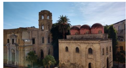
La Martorana & San Cataldo