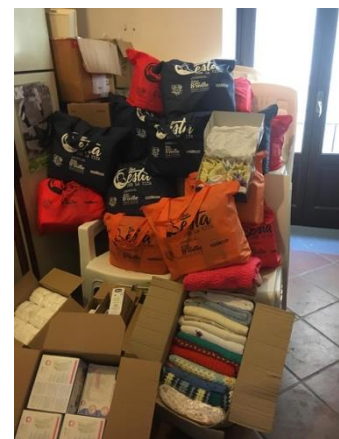
Welcome Baby Bags

Der aktuelle Gerichtsprozess gegen die nigerianische Mafia „Black Axe“, zu dem ich gern gehen wollte, ist momentan leider ausgesetzt. Grund hierfür ist der Tod eines der Mitglieder dieser Vereinigung im Gefängnis. Bisher ist die genaue Todesursache ungeklärt und bis zur Klärung wird der Prozess nicht weitergeführt.