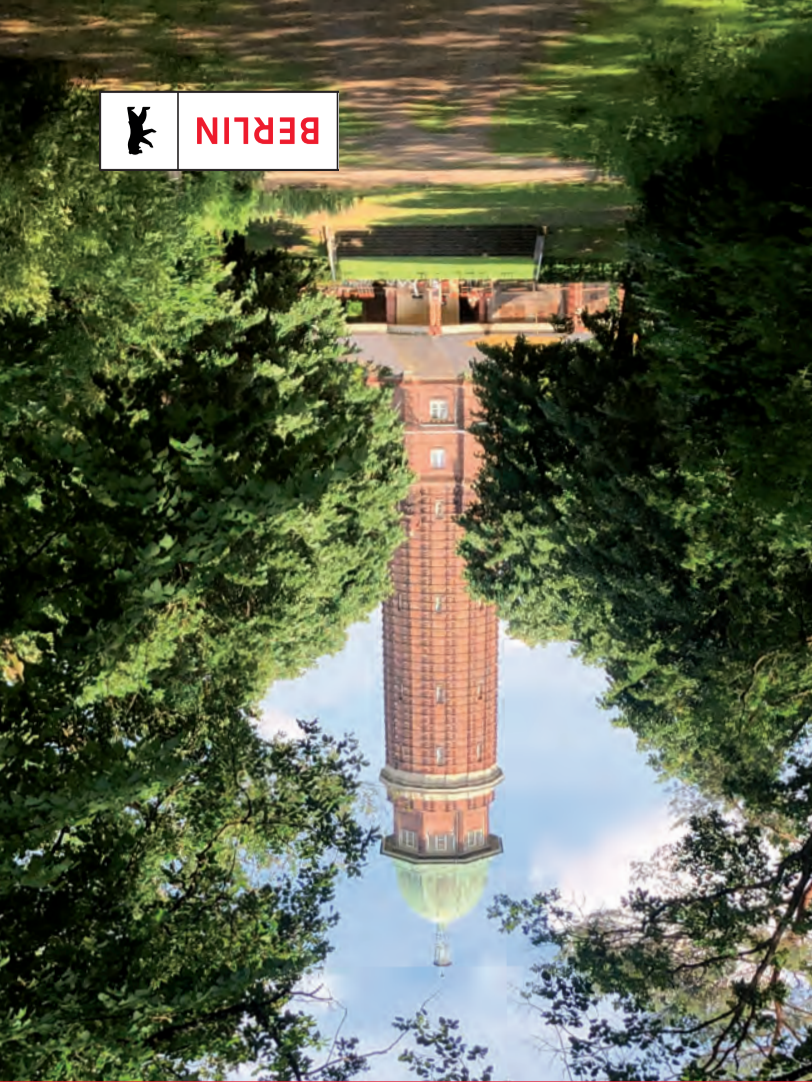
Erkunde Flora, Fauna und Historisches in einem Gartendenkmal von 1923