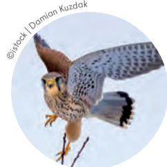
Turmfalke heißen so, weil sie ihre Jungtiere gerne in hohen Gebäuden aufziehen.

Vergleiche die historische Zeichnung des Wasserturms mit dem tatsächlichen Bauwerk. Welche Unterschiede findest du?