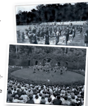
Um 1930 ging es im Volkspark Jungfernheide sehr lustig zu. Körperliche Erfrischung war groß in Mode.

1904 kaufte die Stadt Charlottenburg Teile der Jungfernheide für die Anlage eines großen Parks. Mit der Erstellung eines Planes für die Gartenanlage wurde der Gartenbaudirektor Erwin Barth beauftragt. Allerdings wurde die Umsetzung der ersten Entwürfe durch den Beginn des Ersten Weltkriegs 1914 verhindert. Nach dem Krieg erstellte Barth überarbeitete Pläne, deren Ausführung diesmal wegen der Haushaltssperre aufgrund der bevorstehenden Eingemeindung Charlottenburgs in Groß-Berlin verrietelt wurde.