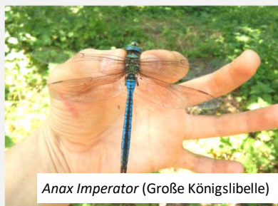
Anax Imperator (Große Königslibelle)