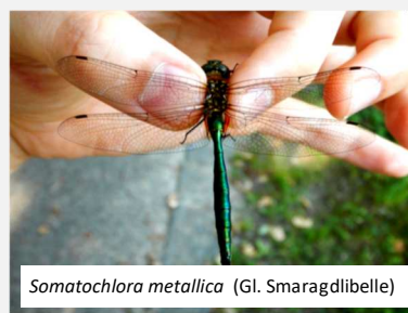
Somatochlora metallica (Gl. Smaragdlibelle)