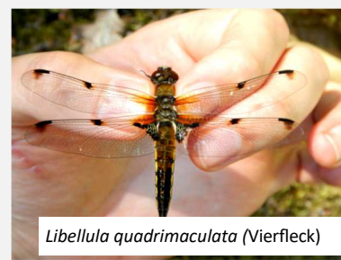
Libellula quadrimaculata (Vierfleck)