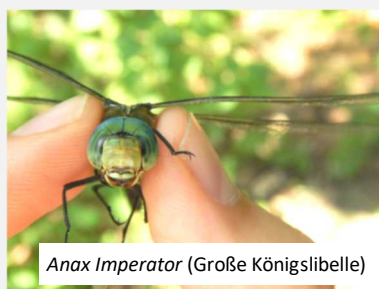
Anax Imperator (Große Königslibelle)