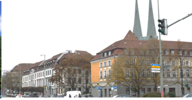
Nikolaiviertel mit Nikolaikirche