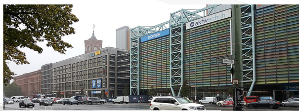
Rathaus Passagen