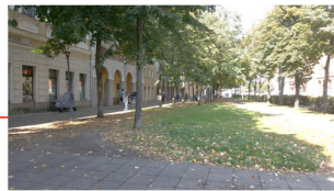
Spandauer Straße vor Nikolaiviertel