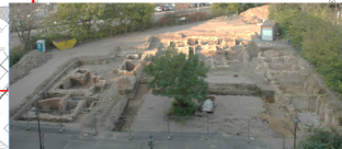
Grabungen im Jüdenhof