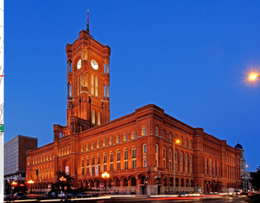
Rotes Rathaus