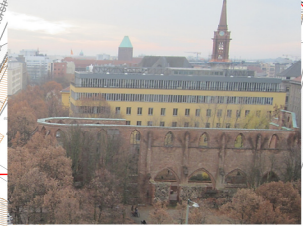
Ruine der Klosterkirche und Parochialkirche