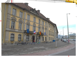
Alte Münze