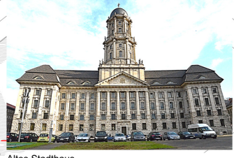
Altes Stadthaus