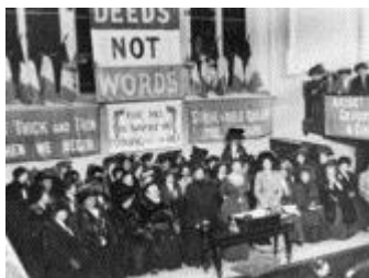
Suffragettes, England, 1908