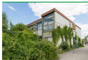
Bibliothek Rudow in der Clay-Schule

Am südlichsten Bibliotheksstandort in Neukölln bieten wir ca. 36.000 aktuelle Medien zur Ausleihe. Außerdem stehen zwei Computerarbeitsplätze, kostenfreies WLAN sowie Einzel- und Gruppenarbeitsplätze zur Verfügung. Gerne beraten wir Sie auch zu den digitalen Angeboten des VÖBB, z.B. der Ausleihe von E-Book-Reader.