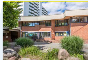
Bibliothek im Gemeinschaftshaus Gropiusstadt

Bei einem Bestand von 35.000 Medien für alle Altersgruppen, in denen auch zahlreiche Spielfilme und TV-Serien enthalten sind, bieten wir auch WLAN und 3 Computerarbeitsplätze an.