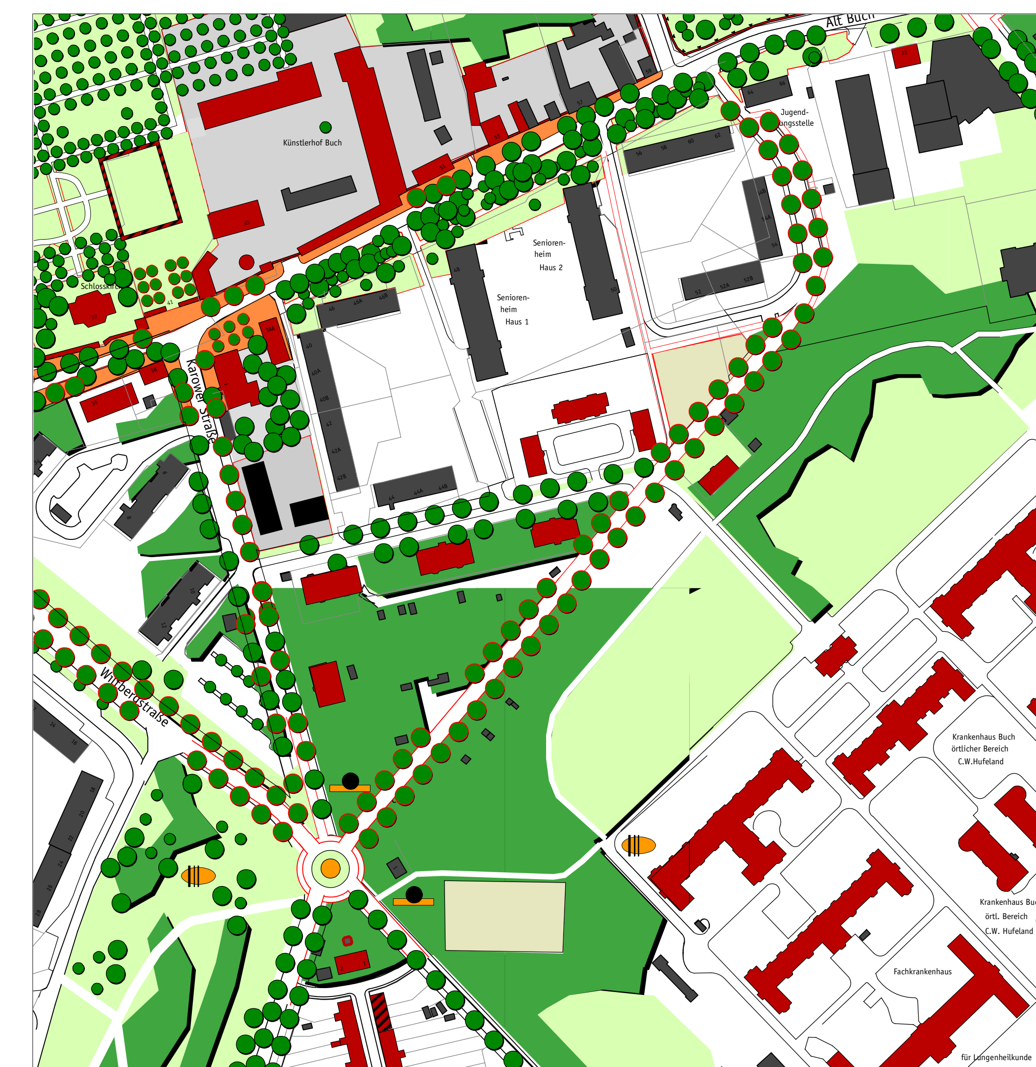
Variante zur Kreuzung Wiltbergstraße - Lindenberger Weg - Karower Chaussee