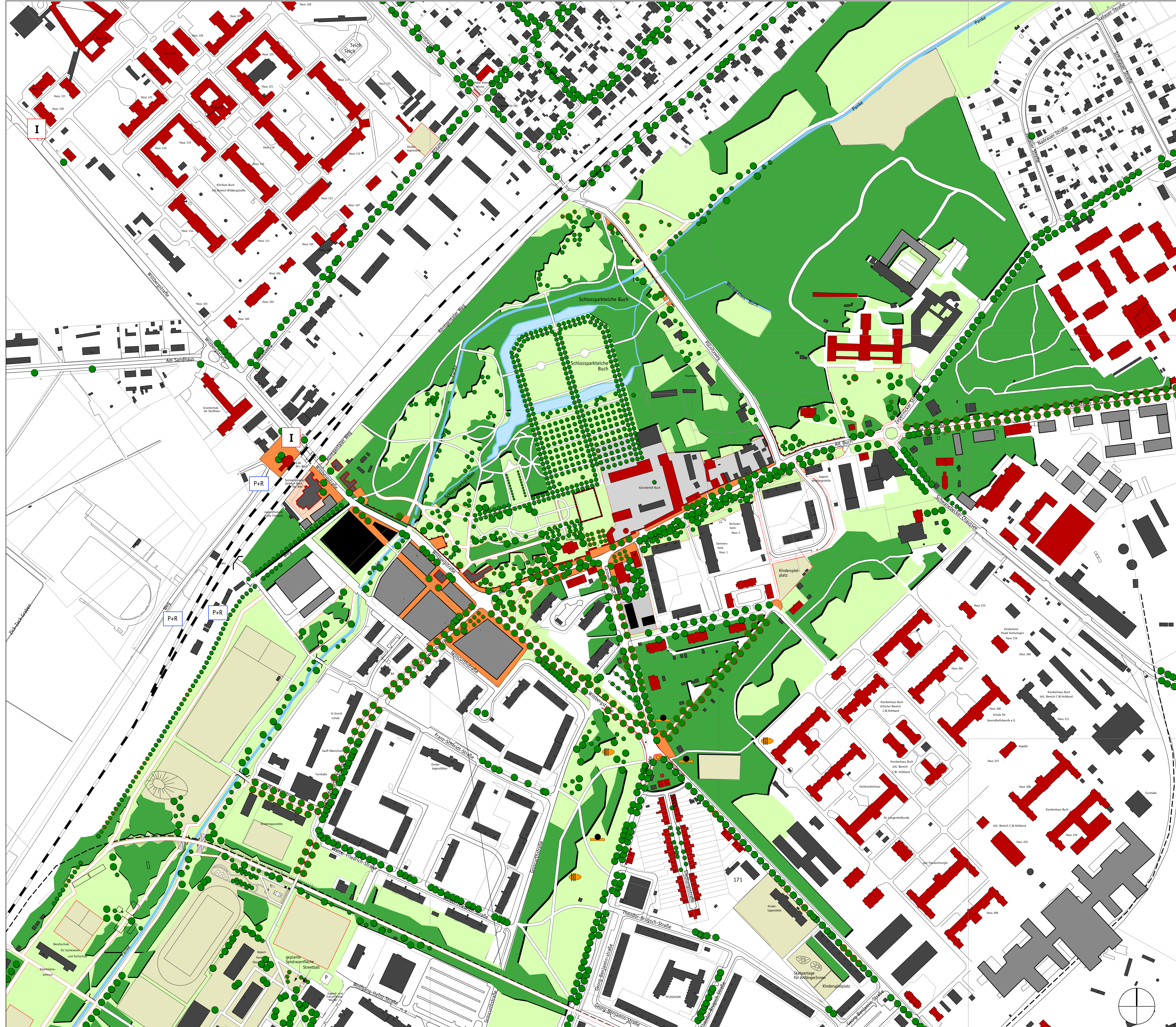
Panke-Park Buch, mittlerer und südlicher Teil Planungsstand übernommen aus: Weiterentwicklung Naherholungsgebiet Bertiner Barnim, Mai 2003