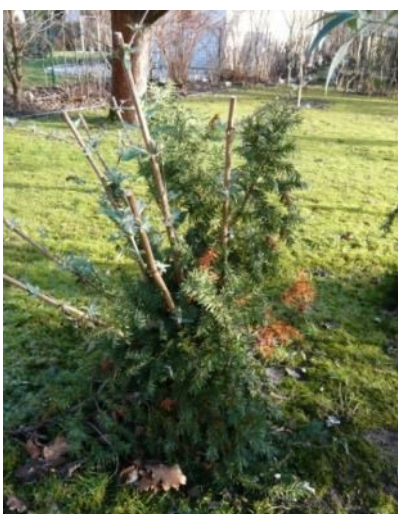
Winterschutz an Sommerflieder

Rosen benötigen speziellen Winterschutz. Wenn die Temperaturen dauerhaft niedrig bleiben, werden sie locker mit Gartenerde angehäufelt, besser mit reifem Kompost oder Rindenmulch. Besonders frisch gepflanzte Rosen sollten zusätzlich mit Nadelholzreisig eingedeckt werden. Kletterrosen erhalten in sonnenexponierter Lage zusätzlichen Schutz durch Schattierung mit Reisig oder Schattenleinen. Die Kronen von Rosenstämmchen können mit Tannenreisig eingebunden und zur Fixierung mit Jutesäcken umhüllt werden. Der Stamm und besonders die Veredlungsstelle werden mit Reisig und Strohmatte ebenfalls vor Sonne und Austrocknung bewahrt. Für den Winterschutz sind solche Materialien am besten geeignet, die luftdurchlässig sind und eine Zirkulation zu lassen, um bei Verdunstung oder nach Niederschlägen der Fäulnis vorzubeugen. (Noppen-)Folien sind für diese Zwecke weniger brauchbar, sie finden Verwendung, um z.B. Pflanzcontainer aus Terracotta zu schützen.