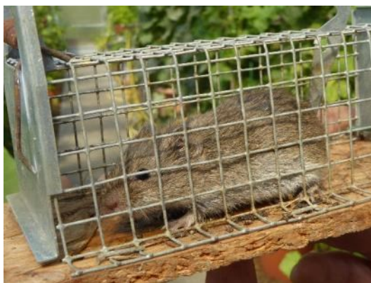
Wühlmaus in Lebendfalle