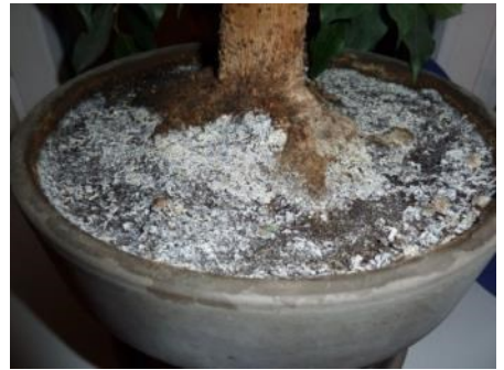
Kalk- und Salzablagerungen

An feucht-kühlen Standorten hingegen kann Grauschimmel ( Botrytis ) auftreten. Zunächst werden abgestorbene Pflanzenteile von grauem Pilzrasen überzogen. Später breitet sich Grauschimmel über die Pflanzenteile und das (nasse) Substrat aus. Ausputzen, ein luftiger und ggf. wärmerer Standort unterbinden die Ausbreitung. Kalk- und Salzablagerungen auf der Bodenoberfläche und am Topfrand entstehen ganzjährig. Sie sind trocken/krümelig und lassen sich mechanisch entfernen.