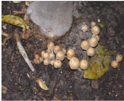
verpilztes Substrat mit Fruchtkörpern