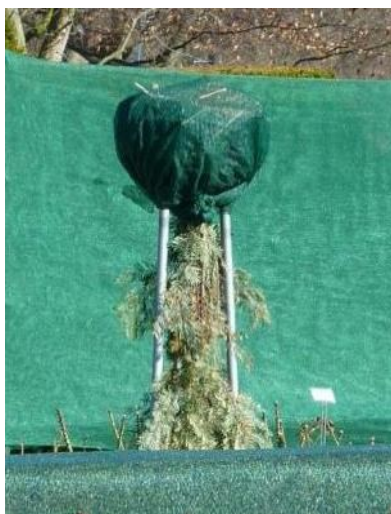
und an Rosenstämmchen