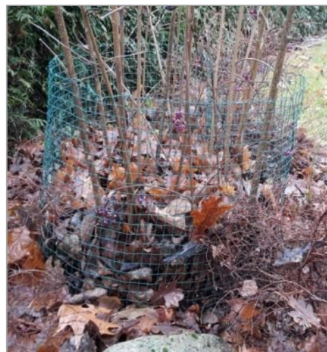
Laubschutz im Ring aus Kaninchendraht