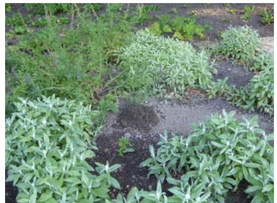
Erdauswurf mit Gangsystem von Wühlmäusen