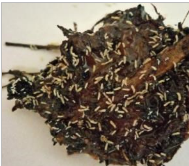
Springschwänze im Kompost und in Nahaufnahme

Diese Auffälligkeiten treten jetzt verstärkt auf, weil die Zimmerpflanzen es mit anderen Bedingungen zu tun bekommen, wenn die Räume über den Winter beheizt werden. Die Pflanzen haben einen hohen Lichtbedarf, der Standort nah am Fenster ist meist gleichbedeutend mit trockener Heizungsluft. Entsprechend kann der Wasserbedarf höher sein, ein Zuviel schafft optimale Bedingungen für die Massenvermehrung bodenlebender Insekten.