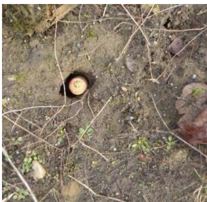
Futterprobe Mäuseloch mit Möhre