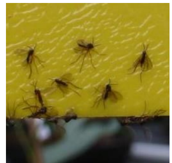
Trauermückenlarven an Wurzel und Trauermücken auf Gelbtafel

Die 2 mm langen Springschwänze ( Collembolen ) ernähren sich von verrottender toter organischer Substanz, nur sehr selten von Feinwurzeln in nassen Topferden. Als Humusbildner haben sie eine wichtige ökologische Funktion im Stoffkreislauf, sie treten massenhaft im Kompost auf. Wenn sie im Blumentopf lästig werden, kann man die Erde kurz überschwemmen und dann die auf der Wasseroberfläche schwimmenden Springschwänze abgießen. Wird danach das Substrat trockener gehalten, ggf. mit einer dünnen Sandschicht abgedeckt, verschwinden sie wieder.