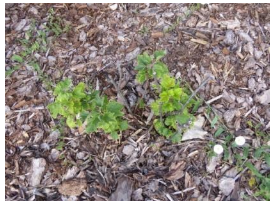
Wuchsdepression an Johanniskeule durch Wühlmausbefall