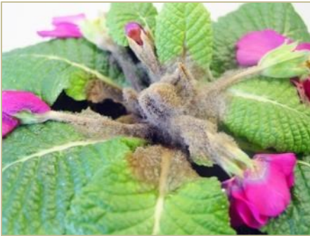
Grauschimmel an Primel

Die genannten Substratverpilzungen schädigen die Pflanzen nicht direkt. Wegen optischer Beeinträchtigung und potentielle Eiablagestelle für Trauermücken sollte aber die Pilzschicht entfernt werden. Längere Gießintervalle und eine dünne Sandschicht lassen die Oberfläche der Topferde besser abtrocknen.