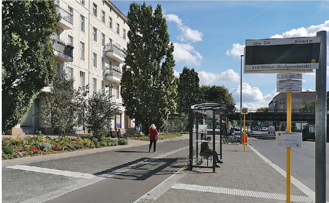
Der neue westliche Vorplatz der Yorckbrücken nach der Sanierung 2022