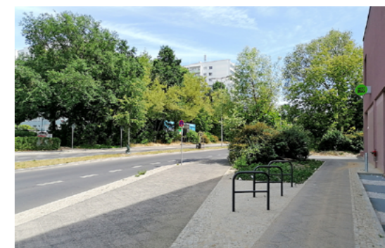
4 Die 2022 sanierte Fußgängerpromenade führt von der Walter-Friedrich-Straße bis zur Groscurthstraße zum geplanten Bildungs- und Integrationszentrum in Buch.