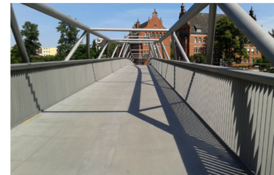
5 Der neue Alfred-Lion-Steg bildet das Kernstück eines Ost-West-Grünzuges und ermöglicht seit 2012 eine neue Verbindung zwischen Tempelhof und Schöneberg.