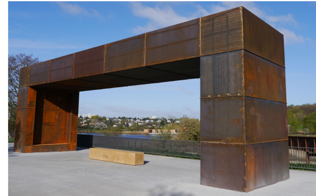
1 Das „Hellersdorfer Fenster“ am Eingang zum Wuhleletal wurde zur IGA 2017 geschaffen und markiert den besonderen Ort sehr prägnant.