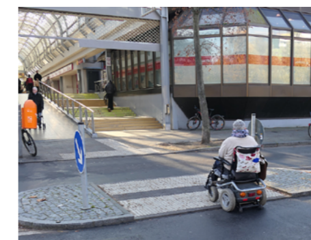
3 Die neue Mittelinsel mit taktilen Streifen verbessert seit 2021 den nördlichen Zugang zum Märkischen Zentrum.