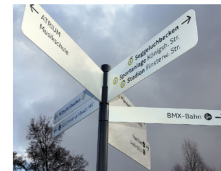
2 Zur besseren Orientierung dient seit 2016 ein Richtungsweiser des neuen Leit- und Infosystems im Märkischen Viertel