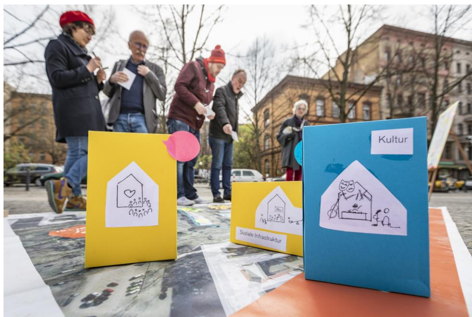
Abbildung 1: Gespräche an der Bodenplane

Mittwoch, 10.04, 13-16 Uhr – Rathaus Kreuzberg