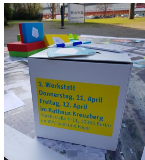
Abbildung 4: Postkarten und Werbematerial (ZebraLog)