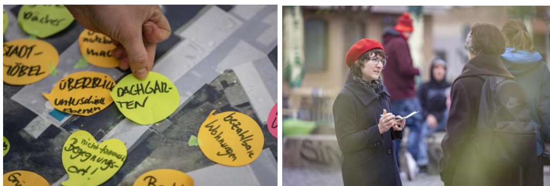
Abbildung 5- 6: Ideen-Verortung und Gespräche mit Passant*innen