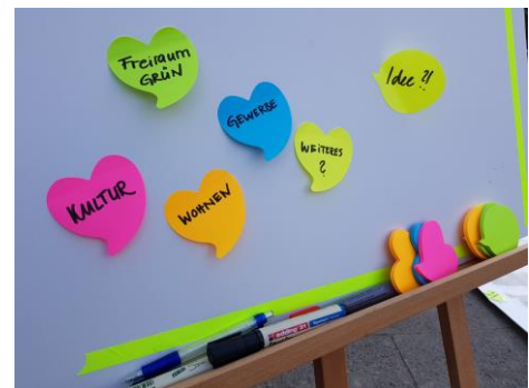
Abbildung 3: Themenkategorien (ZebraLog)