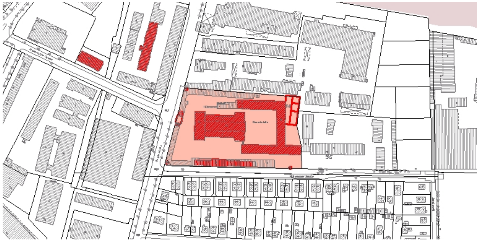
Ausschnitt aus der Denkmalkarte.