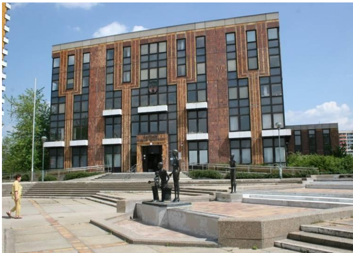
Helene-Weigel-Platz Rathaus Marzahn 1985-88, Arch. Wolf Rüdiger Eisentraut u.a. 2008