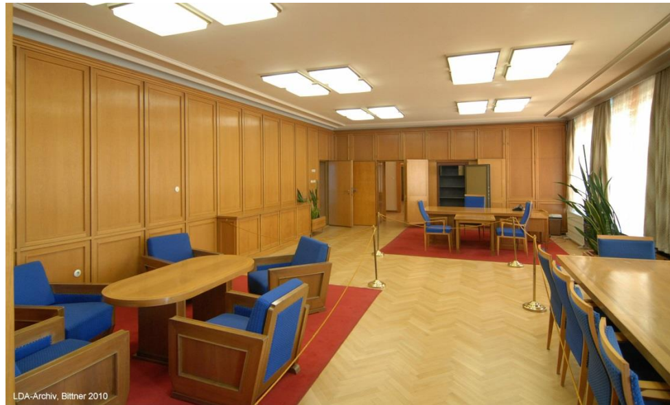
„Mielke-Zimmer“ nach der Restaurierung. 2010