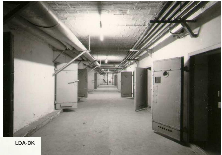
„U-Boot“ im Keller der ehemaligen Großküche. Foto: LDA 1993