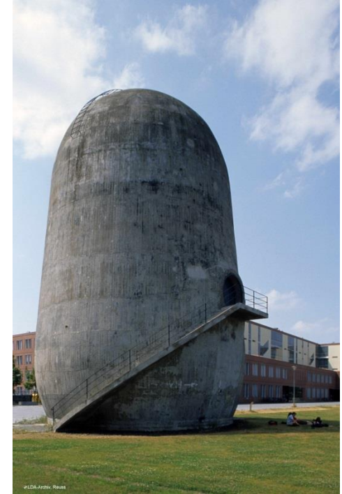
Rudower Chaussee Trudelturm 1935-36, Arch. Hermann Brenner