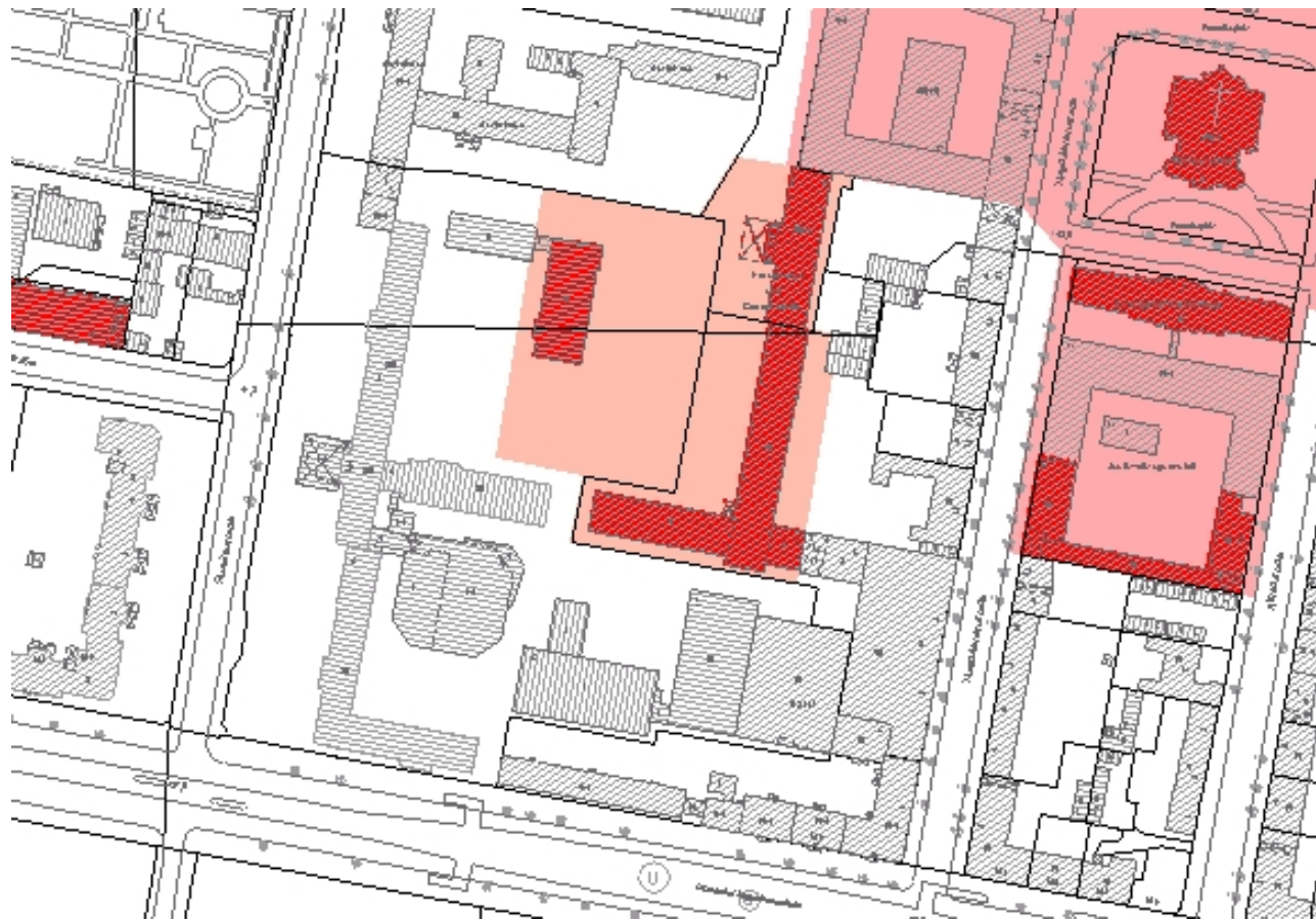
Ausschnitt aus der Denkmalkarte. Abbildung: LDA