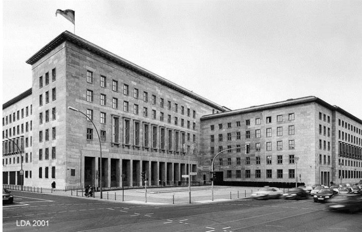
Leipziger Straße / Wilhelmstraße Ehem. Reichsluftfahrtministerium 1935-36, Arch. Ernst Sagebiel