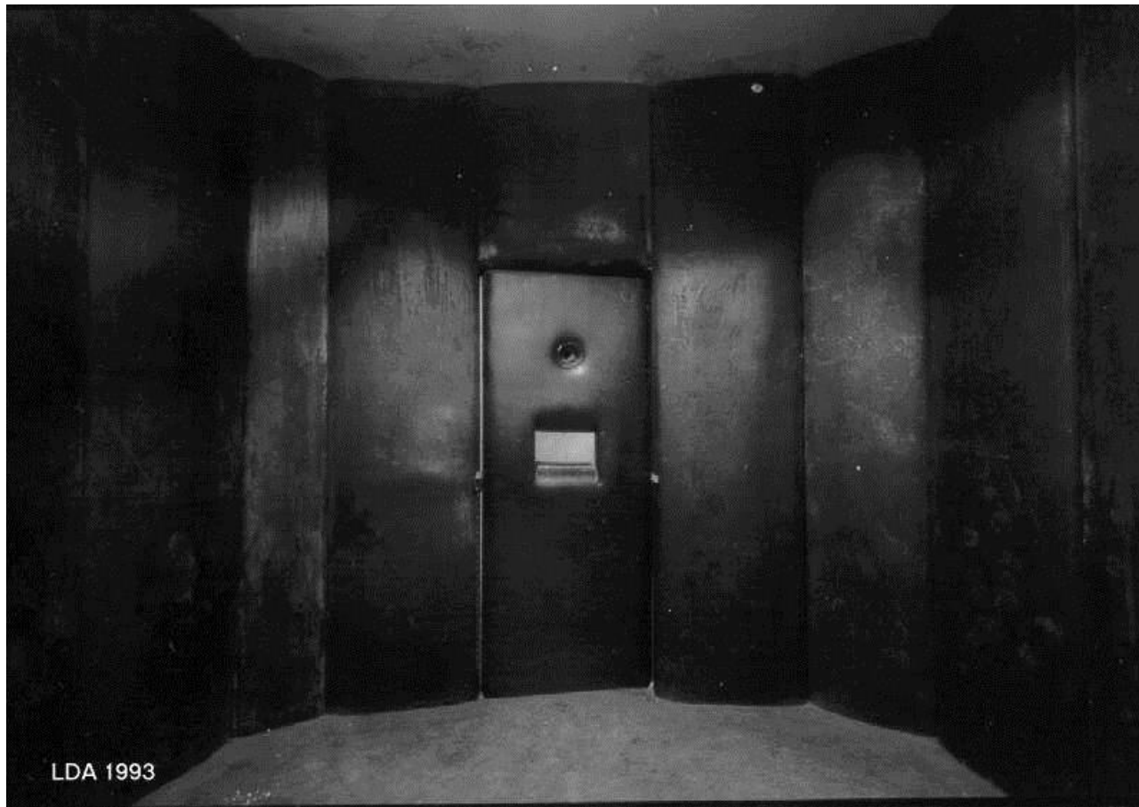
Gummizelle im „U-Boot“.