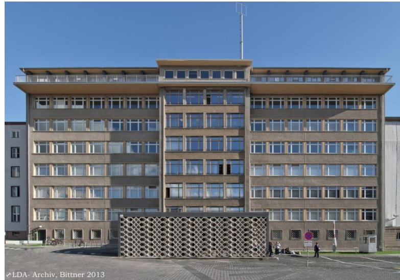
Haus 1. Stasi-Museum.