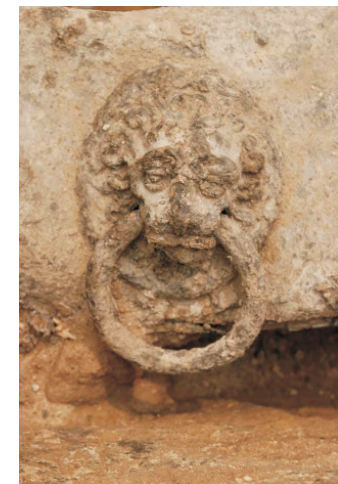
Löwenkopf am Zinnsarkophag aus der Gruft in der Domkirche

18.00 Uhr Neues Museum, Museumsinsel Besichtigung der neuen Dauer- ausstellung des Museums für Vor- und Frühgeschichte