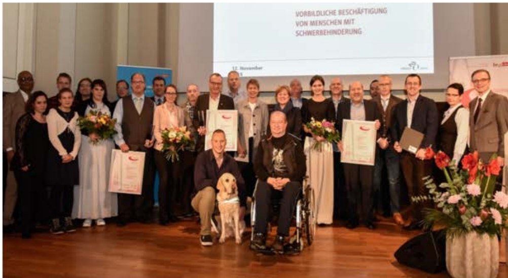
Gruppenbild: Senatorin Breitenbach und Präsident Allert mit den Gewinnern