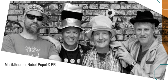
Musiktheater Nobel-Popel

Ein lustiges und lehrreiches Liedertheaterstück mit viel wunderbarer Musik zum Mitmachen und Staunen. Ein Dreieck, ein Viereck und ein Kreis wollen mit den Kindern schnullebatzen. Aber was bedeutet dieses komische Schnullebatzen eigentlich? Die Drei behaupten jedenfalls, dass schnullebatzen allen viel Freude, Spaß und gute Laune bringt.