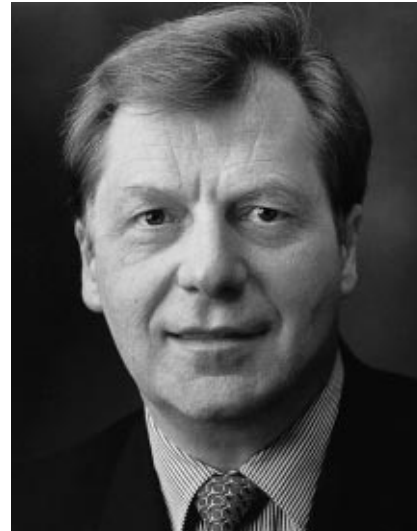
Eberhard Diepgen Regierender Bürgermeister von Berlin

Als Nachbar, gewissermaßen Tür an Tür und Turm an Turm freuen mich die Baufortschritte im Alten Stadthaus natürlich besonders. Es ist ein gutes altes Stück Berlin, das vielfach wieder in seinen ursprünglichen Zustand gebracht wird. „Großstadtarchäologie“ wurde die Entdeckung der Baugeschichte des Hauses beim Abtragen jüngerer Bauschichten bereits genannt. Mit der Eröffnung des Bärensaals ist ein weiterer Schritt getan.