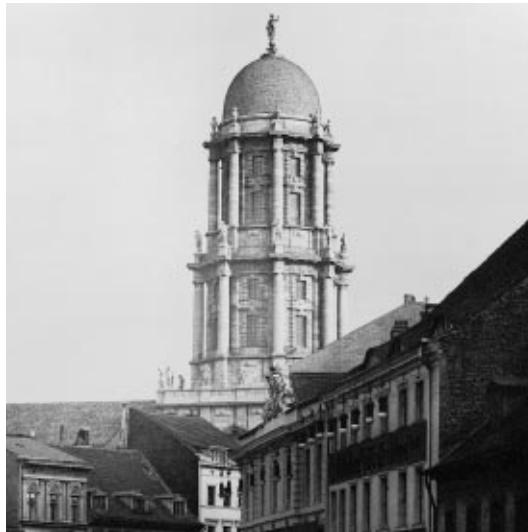
Blick vom Ephraimpalais am Molkenmarkt, 1911