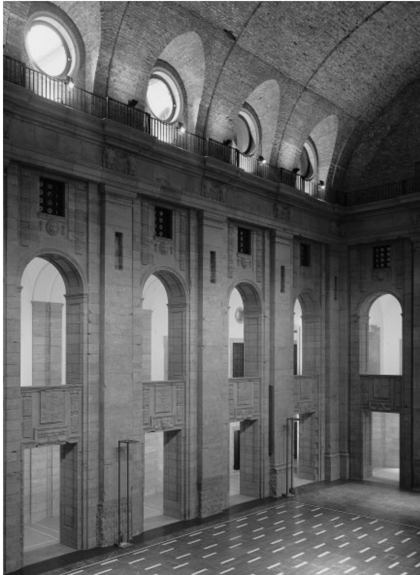
Der Bärensaal nach seiner Wiederherstellung, Mai 1999