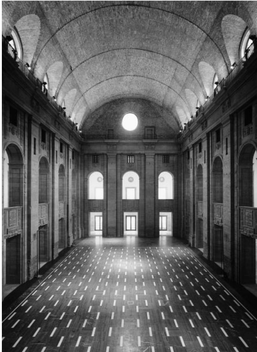
Der Bärensaal nach seiner Wiederherstellung, 1999