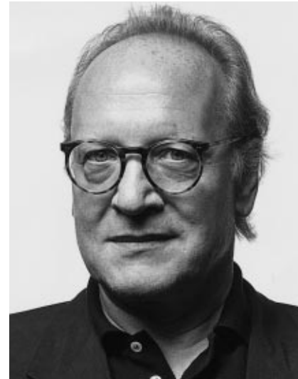
Gerhard Spangenberg Architekt

Im Jahr 1994 wurden wir nach einem vorangegangenen kleinen Wettbewerb als „Patenarchitekten“ des Alten Stadthauses beauftragt. Dieser vom damaligen Senatsbaudirektor, Hans Stimmann, geprägte Begriff umschreibt eine dem Bau des Architekten Ludwig Hoffmann in erster Linie dienende Rolle. Das ganze räumliche und zeitliche Ausmaß dieses Dienstes sollte sich erst später in der praktischen Durchsetzung zeigen. Grundlage der Wiederherstellungs- und Ergänzungsmaßnahmen war – und mußte im täglichen Geschäft der kleinen Schritte immer wieder zurückerobert werden – folgendes Konzept: