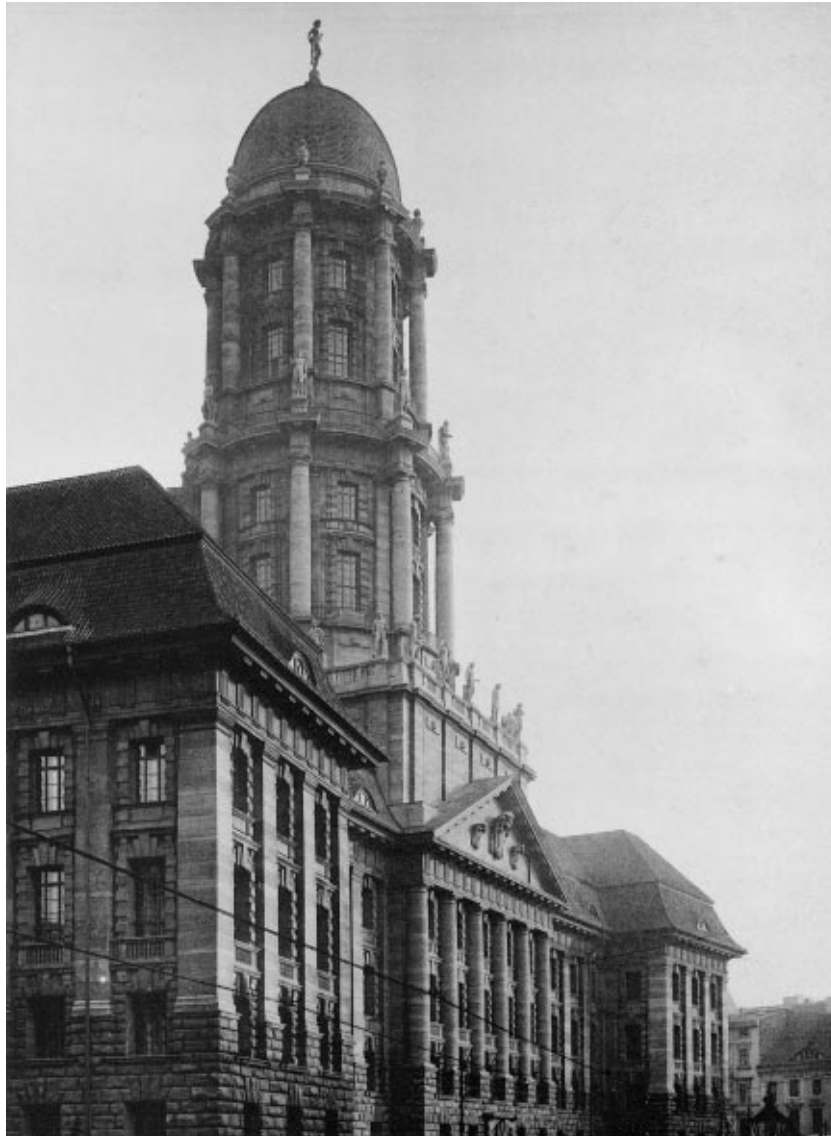
Hauptfassade zum Molkenmarkt, 1911