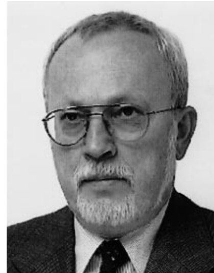
Lothar de Maizière Ministerpräsident a. D.

Manchmal wünscht man sich, daß Steine erzählen könnten. Dies gilt um so mehr für solche, aus denen geschickte Handwerker auf Geheiß von klugen, manchmal sogar genialen Architekten Gebäude oder gar Säle errichtet werden. Da aber Steine, wie bekannt, über diese wünschenswerte Fähigkeit nicht verfügen, müssen sie sich, um Auskunft über ihr Schicksal oder weniger dramatisch ausgedrückt ihre Erlebnisse zu geben, menschlicher Hilfe bedienen. Wenn auch nur als kurzzeitiger Hausherr des nun wieder „Altes Stadthaus Berlin“ heißen Gebäudes, will ich meine Hilfe nicht versagen. Eine der Forderungen des Herbstes 1989, der friedlichen Revolution in der DDR, war die nach freien Wahlen. Der Runde Tisch schuf ein modernes Wahlgesetz