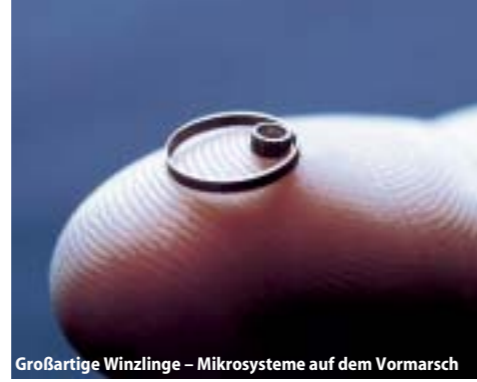
Großartige Winzlinge – Mikrosysteme auf dem Vormarsch