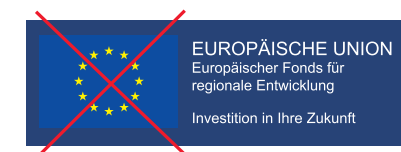
Falsch! Weißer Rahmen fehlt.