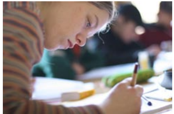
Sie holt das Abitur nach; Sie auch?

Wenn Sie die o. g. Tages- oder Abend-Einrichtungen ohne Erwerb der allgemeinen Hochschulreife verlassen, aber mindestens zwei aufeinanderfolgende Halbjahre der Qualifikationsphase erfolgreich absolviert haben, so wird Ihnen der schulische Teil der Fachhochschulreife zuerkannt.