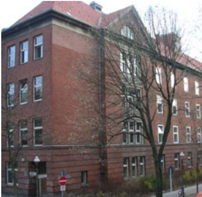
Wo Zuckmayer draufsteht, steckt mittlerer Schulabschluss drin - Zuckmayer-Schule (Realschule) in Neukölln

➔ Informationen zur Nichtschüler-Prüfung siehe Seite 15