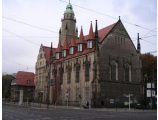
Friedrich-Fröbel-Schule: Fachoberschule für Sozialwesen/Sozialpädagogik in Treptow-Köpenick

Weitere Einzelheiten wie mögliche Wartezeiten, Auswahlverfahren bei Übernachtung, Bafög-Förderung, Probezeitregelung etc. sind bei den Fachoberschulen zu erfragen.