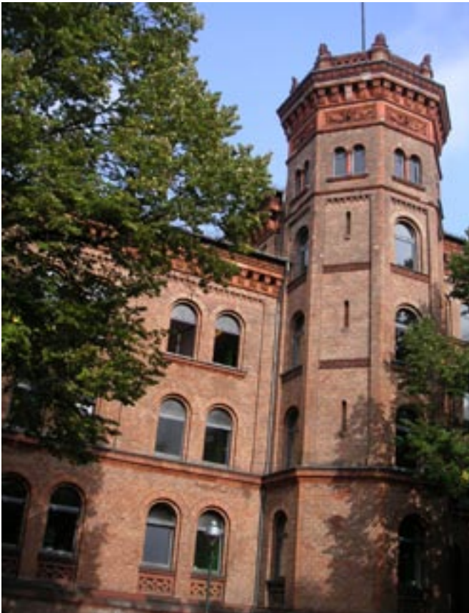
My school is my castle - das Oberstufenzentrum Handel I in Friedrichshain-Kreuzberg: Fachoberschule und Berufsoberschule