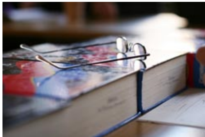
Eine oder zwei? Die Hochschulreife erwerben Sie an der Berufsoberschule - ob fachgebunden oder allgemein hängt von Ihren Fremdsprachen ab.

➔ Adressen der Berufsoberschulen siehe Seite 26 - 31