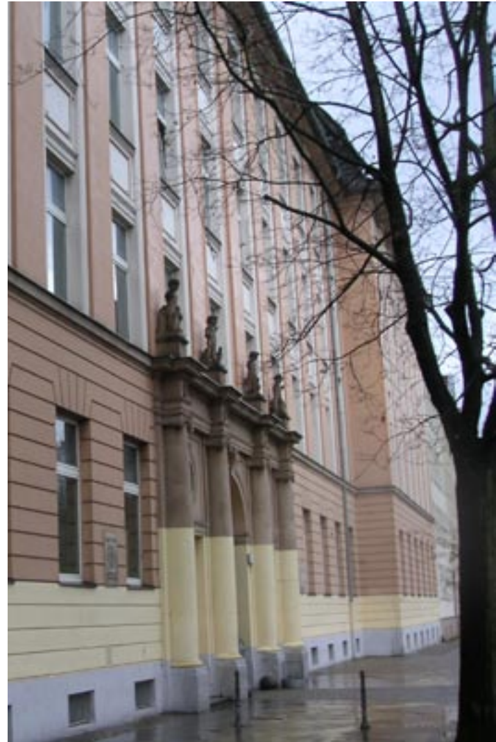
Melden Sie sich doch einfach an: zum Beispiel an der Winkelried-Schule (Realschule) in Mitte.

➔ Informationen zur Nichtschüler- Prüfung siehe Seite 15