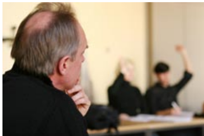
Unter Erwachsenen: die Lehrerinnen und Lehrer kennen die Besonderheiten im zweiten Bildungsweg genau.

Die Fachrichtung Agrarwirtschaft und weitere Schwerpunkte (z. B. Chemie-, Physik- oder Biologietechnik) werden nachfrageorientiert eingerichtet.