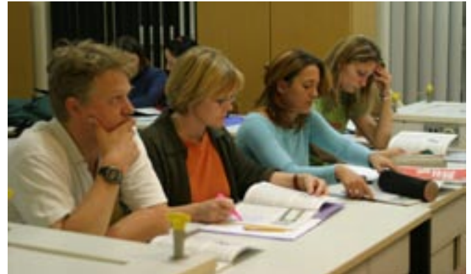
Ohne Fleiß kein Preis; aber in der Gruppe lernt man leichter

Wer die Einführungsphase schon im ersten Bildungsweg erfolgreich beendet hat oder bereits die Fachhochschulreife besitzt, kann bei Erfüllung der Zugangsvoraussetzungen und hinreichenden Vorkenntnissen in zwei Fremdsprachen direkt in die Qualifikationsphase aufgenommen werden.