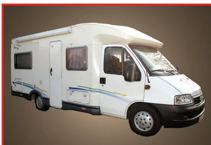
Täterfahrzeug Mordfall Heilbronn 2007 Wohnmobil Chausson / Fiat Ducato