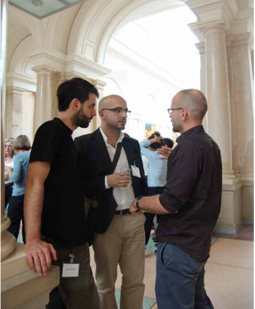
Teilnehmer im Austausch miteinander