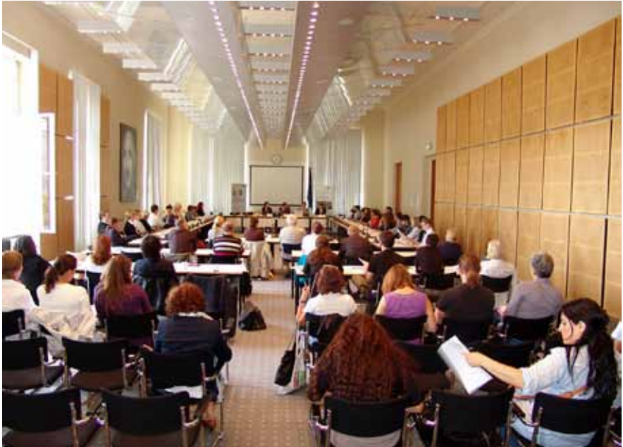
Die Fachwerkstatt findet großes Interesse

niert sehen. Subjektiv ist hier eine genuine Diskriminierungserfahrung gegeben. Ich habe aber Zweifel, ob hier auch objektiv eine Diskriminierung vorlag. Viele der beanstandeten Maßnahmen waren nach meiner Ansicht durch Rechtfertigungsgründe legitimiert, wie durch das Interesse einer Gemeinschaft, vor bestimmten Praktiken geschützt zu werden, beziehungsweise über diese Praktiken informiert zu werden. Auch mit dem Stichwort „Kopftuch“ sind ganz unterschiedliche Einschätzungen verbunden. So würden wir auch in diesem Raum heute wahrscheinlich zu unterschiedlichen Antworten dazu kommen, ob eine bestimmte Verhaltensweise gegenüber einer