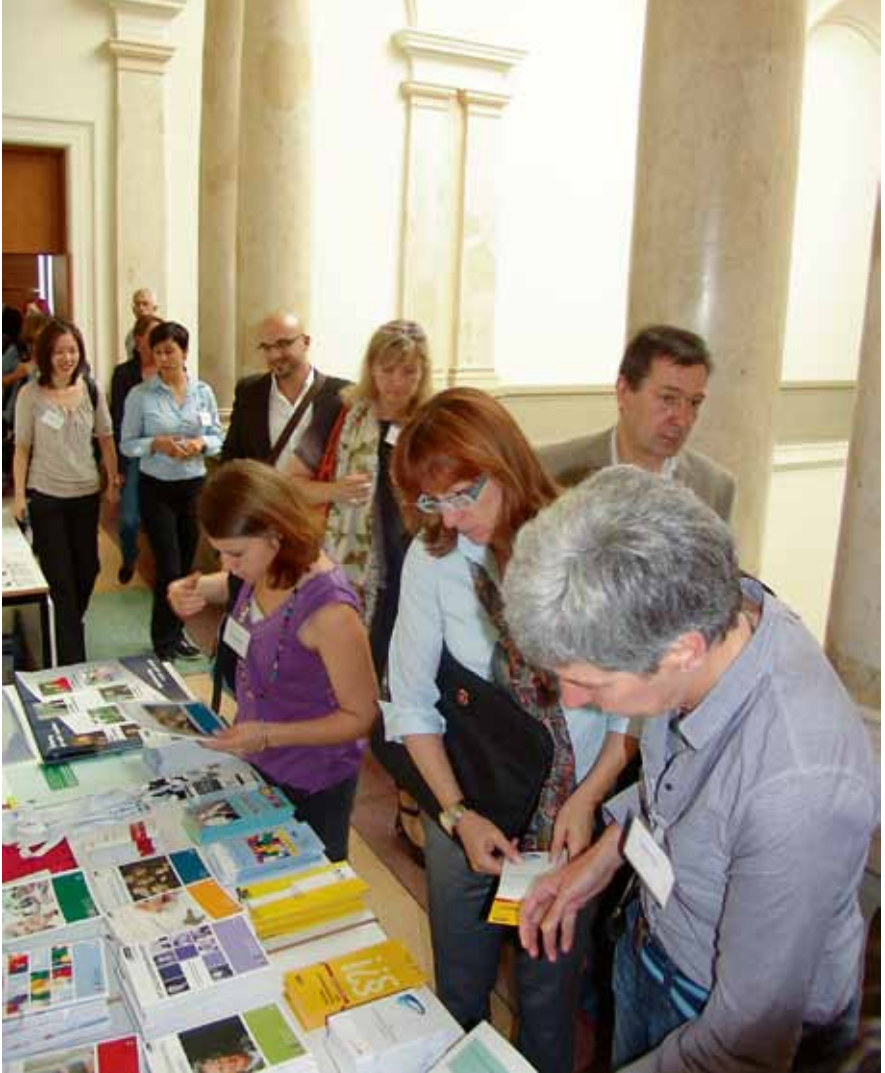
Am Infotisch der LADS