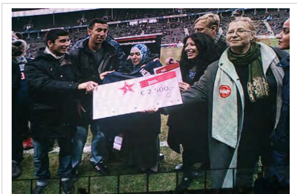
Preisverleihung im Olympiastadion an das Projekt „JUMA“