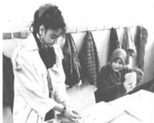
Unterricht in einem Gymnasium in Berlin-Schöneberg

Um diese Fragen geht es auf unserem offenen Diskussionsforum.