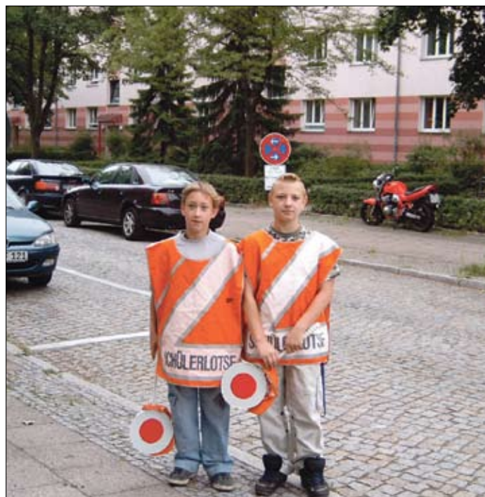
Schülerlotsen vor dem Einsatz

Das Schulamt ist im wesentlichen verantwortlich für alle schulischen Gebäude, die Ausstattung sowie für Schul- und Hortplätze.