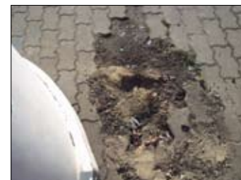
oben: Seelenbinderstr. Venus/Ortolfstr. Fahrbahn- & Gehwegschäden