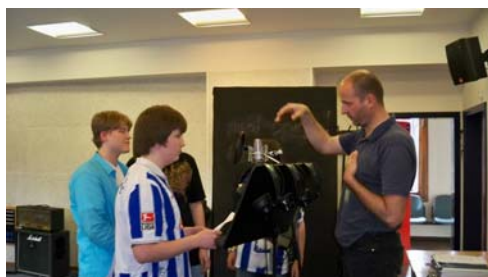
Tonaufnahme in der Landesmusikakademie Berlin

Im Fachbereich Latein übersetzten 20 Schüler/innen der Jahrgangsstufe 9, Strophen diverser Popsongs ins Lateinische. In Zusammenarbeit mit der Musikakademie Berlin fand im Mai 2010 die Aufnahme einer CD statt. Im Rahmen des Projektes erhielten die Schüler/innen u.a. einen Einblick in das Berufsfeld des Tontechnikers. Das Projekt ist abgeschlossen.