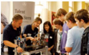
Technik verständlich erklärt von Mitarbeitern der Daimler AG am Aktionstag Ausbildung