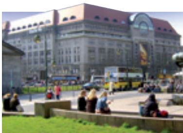
Das KaDeWe am Wittenbergplatz

Sie bieten Pralinen aus Meisterhand oder Brillen am Winterfeldtplatz, Antiquarisches in der Motzstraße oder fast alles auf einer Meile am Tempelhofer Damm – wo der Flaneur auch direkt am Wasser, gewissermaßen bei Hafentmosphäre, fündig werden kann. Besucher und Bewoh-