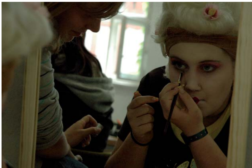
Workshop Maskenbildner/in, „Medienstadt“ 2007

Zum Abschluss präsentieren alle Workshops ihre Ergebnisse und laden dazu Freunde und Familien ein.