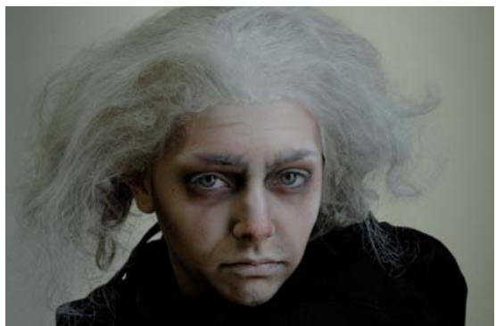
Workshop Maskenbildner/in „Medienstadt“ 2007