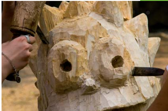
ARTverwandt, 2011 - Workshop: Bildhauerei

Die gewonnenen (Er)Kenntnisse sind Schlüsselqualifikationen, die den Teilnehmenden bei ihrer Lebensweltorientierung wertvolle Unterstützung bieten können. Selbst nach dem Einstieg in einen Beruf kann auf die gemachten Erfahrungen zurückgegriffen werden.