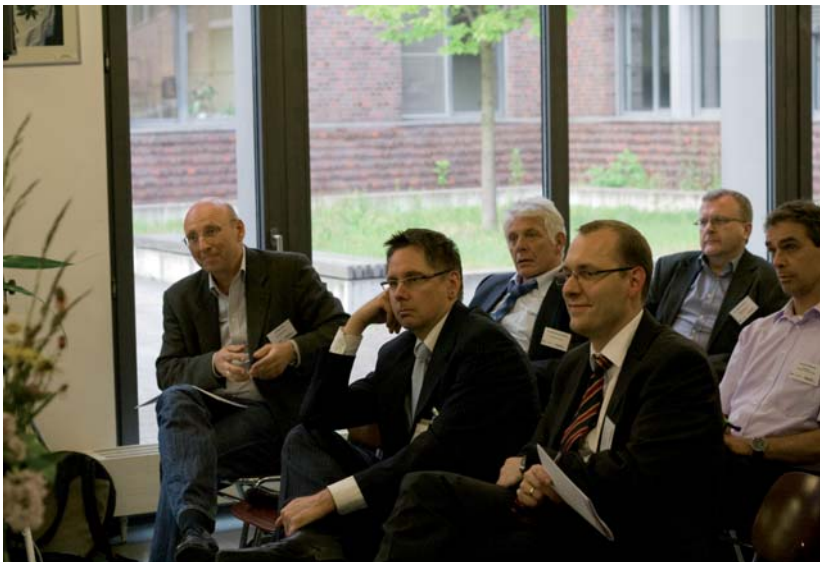
OSZ Gastgewerbe, Themenabend zur Fachkräftesicherung, 2011

Seit einiger Zeit klagen Unternehmensvertreter über den „Facharbeitermangel“. Gleichzeitig haben wir in Berlin immer noch relativ viele Jugendliche, die keine qualifizierte Ausbildung bekommen. Eine der dringenden Aufgaben der Bildungspolitik wird es deswegen werden, dieses Missverhältnis aufzulösen.