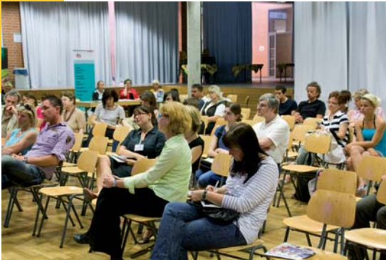
Elternabend Robert-Havemann-Schule, 2011 - Beratung zur beruflichen Erstausbildung

Gemeinsam mit den Pankower allgemeinbildenden Schulen und weiteren professionellen bezirklichen Partnern wie der Berufsberatung der Agentur für Arbeit und vielen anderen Beratungsstellen sowie Wirtschaftsvertreterinnen und -vertretern werden drei themenzentrierte Elternabende angeboten, die Eltern bei der Lebenswelt- und Berufsorientierung ihrer Kinder Unterstützung geben sollen.