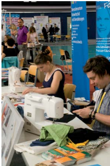
4. Ausbildungstag Pankow, 2011 - Schneider

Die „Berufe zum Ausprobieren“ werden im Unterricht sowohl vor- als auch nachbereitet und sind somit an der Gustave-Eiffel-Schule ein Bestandteil des Dualen Lernens.