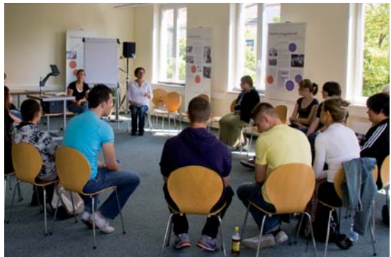
Berufsorientierungswoche für Oberschulen, 2011