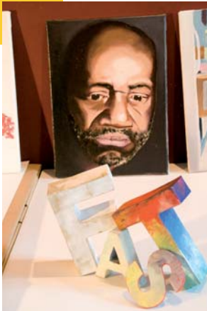
ARTverwandt, 2011 - Präsentation

Weitere Informationen: www.artverwandt-berlin.de