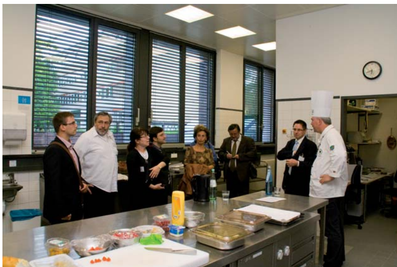
OSZ Gastgewerbe, Themenabend zur Fachkräftesicherung, 2011