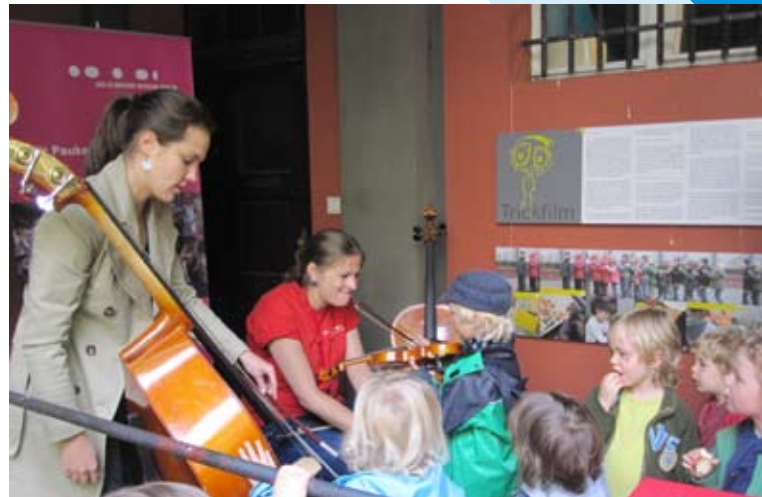
KinderKünsteZentrum Neukölln in der Ganghofer Straße

Eine Anerkennung für ihre herausragende Arbeit in dem Modellprojekt „Kitas bewegen – für die gute gesunde Kita“ erhielten u. a. zwei Kindertagesstätten unseres Kooperationspartners Ina.Kinder.Garten e.V.