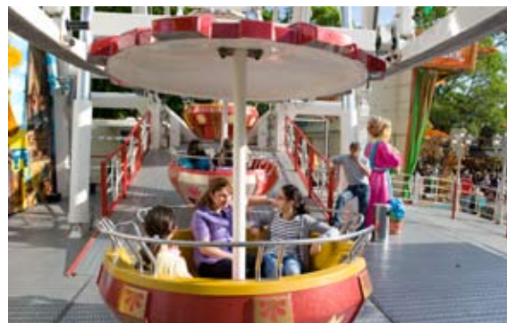
Neukölln-Fest in der Hasenheide