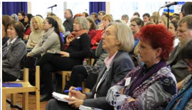
2. Neuköllner Gesundheitskonferenz.

In Auswertung unseres ersten Treffens hat das Beschäftigungsnetzwerk Gesundes Neukölln acht Handlungsfelder bestimmt. Wir stellen in den kommenden Newslettern die Projekte und den Stand ihrer aktuellen Umsetzung vor: