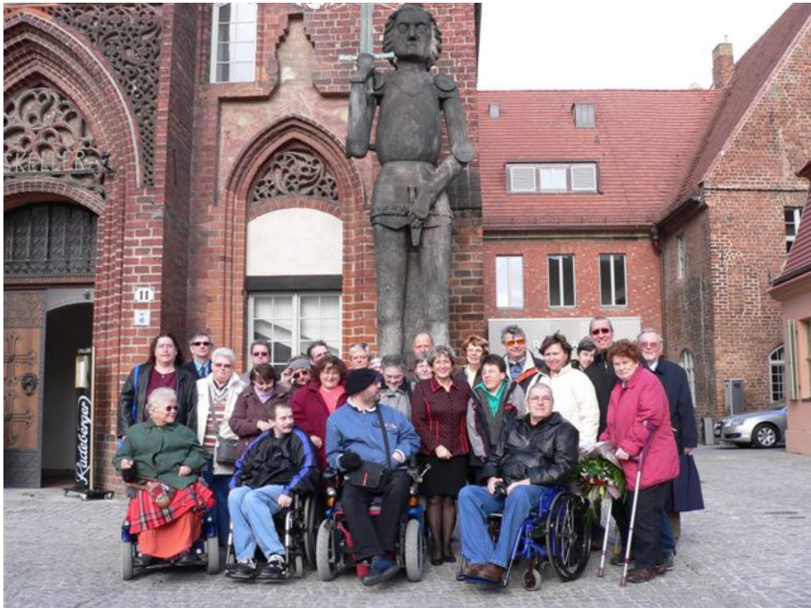
Erfahrungsaustausch der Behindertenbeiräte Mitte von Berlin und Stadt Brandenburg/Havel

Seit September 2008 besteht ein freundschaftlicher Fachaustausch mit dem Behindertenbeirat Brandenburg/Havel, der 2009 seine Fortsetzung findet.