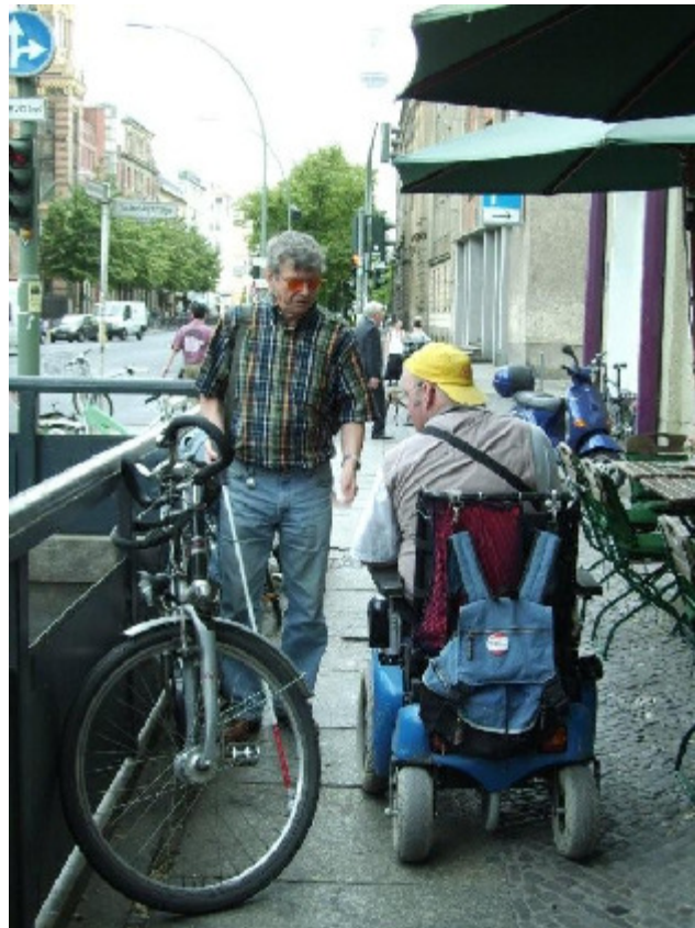
Oranienburger Straße

Gehwege, die für den Fußgängerfluss geschaffen bzw. verbreitert wurden, wurden zweckentfremdet. Dieser Tendenz galt und gilt es Einhalt zu gebieten. Die Durchsetzung des Berliner Straßengesetzes, wo Sondernutzungen nicht den überwiegend öffentlichen Interessen von Bürgern/innen mit und ohne Behinderung entgegen stehen dürfen, und auch versagt werden sollen, wenn behinderte Menschen durch die Sondernutzung in der Ausübung des Gemeindegebrauchs erheblich beeinträchtigt werden, ist aus der Sicht der betroffenen Bürger/innen bisher nicht gelungen.