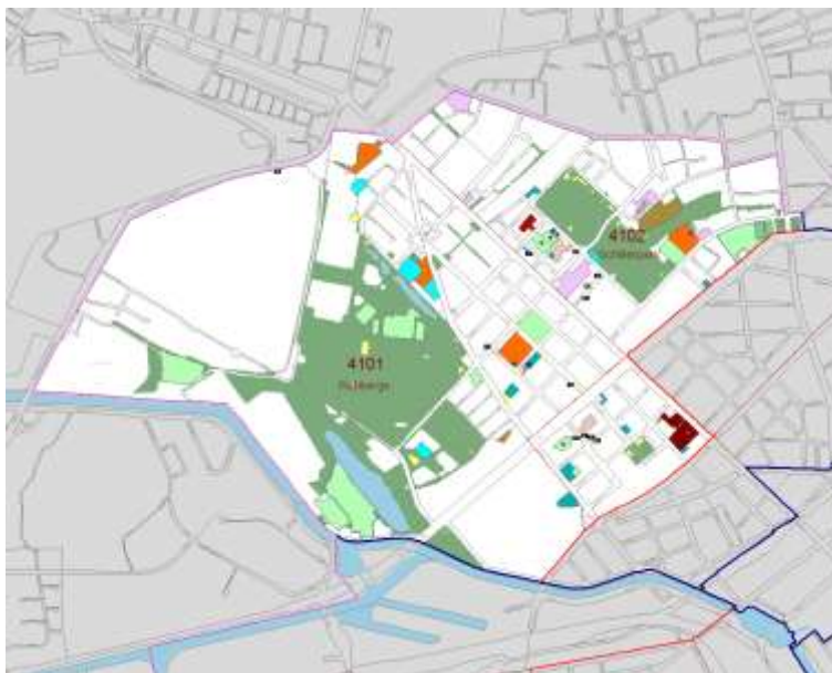
Legende Soziale Infrastruktur

Übersichtskarte Infrastruktureinrichtungen