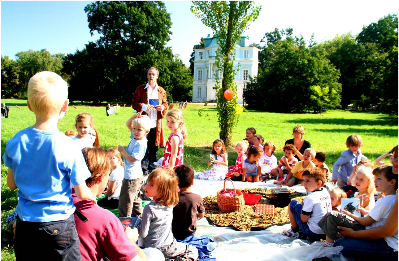
„Lesen im Park“ im Schlossgarten

tenburg-Wilmersdorf unterschrieben. Ziel dieser Kooperation ist es, durch enge Zusammenarbeit beider Einrichtungen die Lese- und Sprachfähigkeit der Kinder zu fördern und zu begleiten und die Fähigkeit zum sachgerechten Umgang mit Medien zu entwickeln.