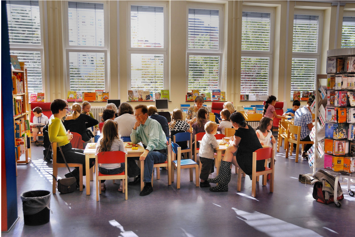
Kinderbereich der neu renovierten Dietrich-Bonhoeffer-Bibliothek