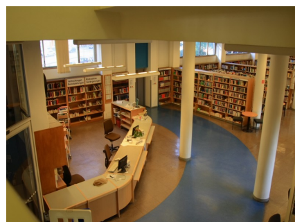
Innenansicht der Dietrich-Bonhoeffer-Bibliothek

Jeden Donnerstag von 16.00 – 17.00 Uhr Vorlesenachmittage für Vorschulkinder und Leseanfänger (Eintritt frei).