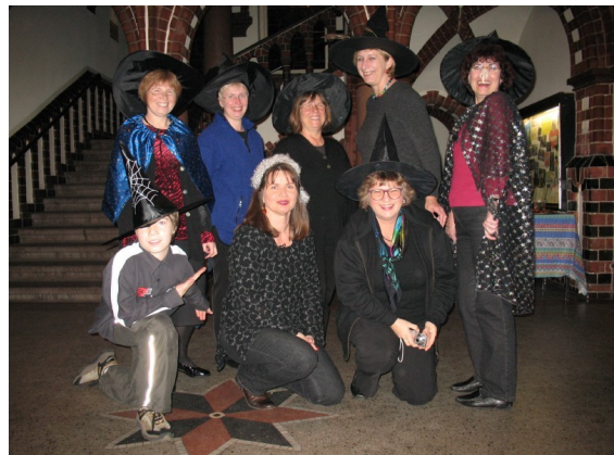
Auf der Suche nach Harry Potter

Möglich wurde die Veranstaltung durch die Kooperation der Stadtbibliothek Charlottenburg mit der Buchhandlung Starick. Das Optikstudio Bilden, die Modeagentur und das Schreib- & Bastel-Paradies in der Breiten Straße beteiligten sich ebenfalls.