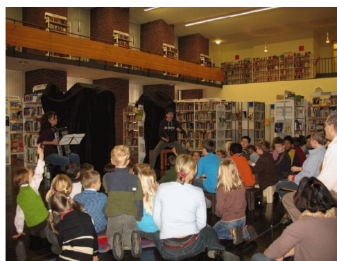
Mio mein Mio

Auch die diesjährigen Berliner Märchentage standen ganz im Zeichen von Astrid Lindgren und ihrer Heimat Schweden. Insgesamt 20 Veranstaltungen fanden in den Stadtbibliotheken des Bezirks im Rahmen der Märchentage statt, teils selbstorganisiert als Märchenfrühstück, teils organisiert durch Märchenland e.V. Erstmals beteiligte sich auch die Musikbibliothek mit einer musikalischen Veranstaltung „Mio mein Mio“ 13 .