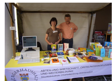
Stand am Tag des Bürgerhaushalts

Das Bezirksamts und die Bezirksverordnetenversammlung Charlottenburg-Wilmersdorf veranstalteten am 24. September im und vor dem Rathaus Wilmersdorf am Fehrbelliner Platz einen „Tag des Bürgerhaushalts“ unter