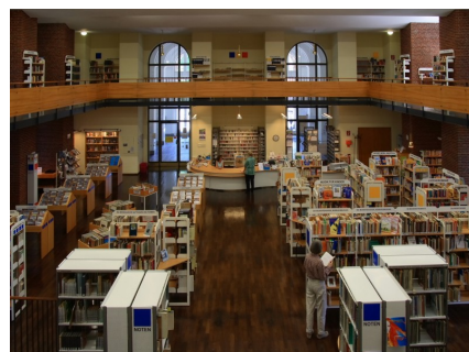
Innenansicht der Musikbibliothek

Der Bestand "Kind & Musik" (Noten, Bücher, Non-Book- Medien) wird gesondert präsentiert.