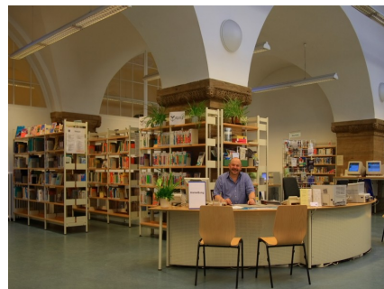
Innenansicht der Heinrich-Schulz-Bibliothek