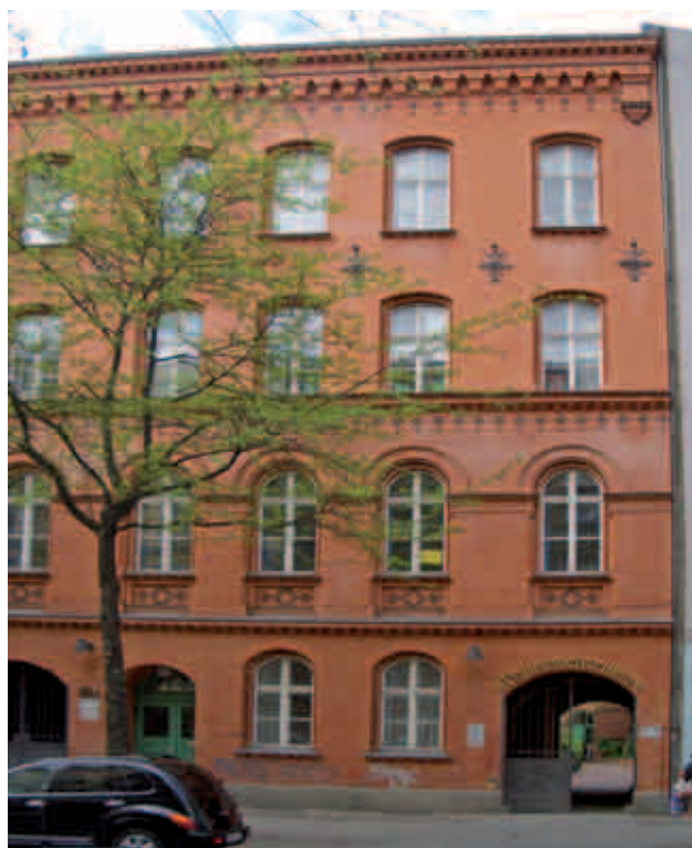
Unterrichtsort und Geschäftsstelle Pestalozzistraße