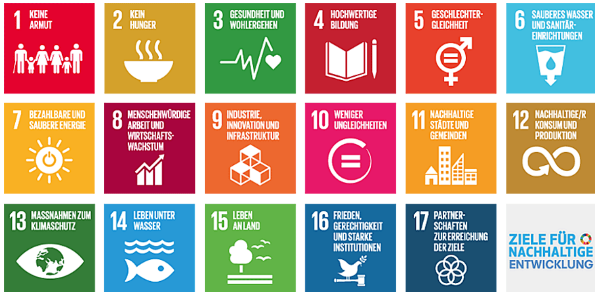
Abbildung 2: Die 17 globalen Nachhaltigkeitsziele / Sustainable Development Goals (SDG)

Durch zwei Beschlüsse der Bezirksverordnetenversammlung Treptow-Köpenick („2030 – Agenda für Nachhaltige Entwicklung auf kommunaler Ebene gestalten (I) und (II)“) wurde im Jahr 2017 ein Bekenntnis zum neuen Handlungsrahmen der Agenda 2030 der Vereinten Nationen ausgesprochen. Dieses Bekenntnis mündete in einen Auftrag an das Bezirksamt Treptow-Köpenick, eine kommunale Nachhaltigkeitsstrategie zu erarbeiten, die sich an der Agenda 2030 und ihren 17 SDGs (Sustainable Development Goals; globale Nachhaltigkeitsziele) orientiert. Dabei konnte man an die bereits im Jahr 2004 erarbeitete Lokale Agenda 21 anknüpfen und einige Strukturen übernehmen.